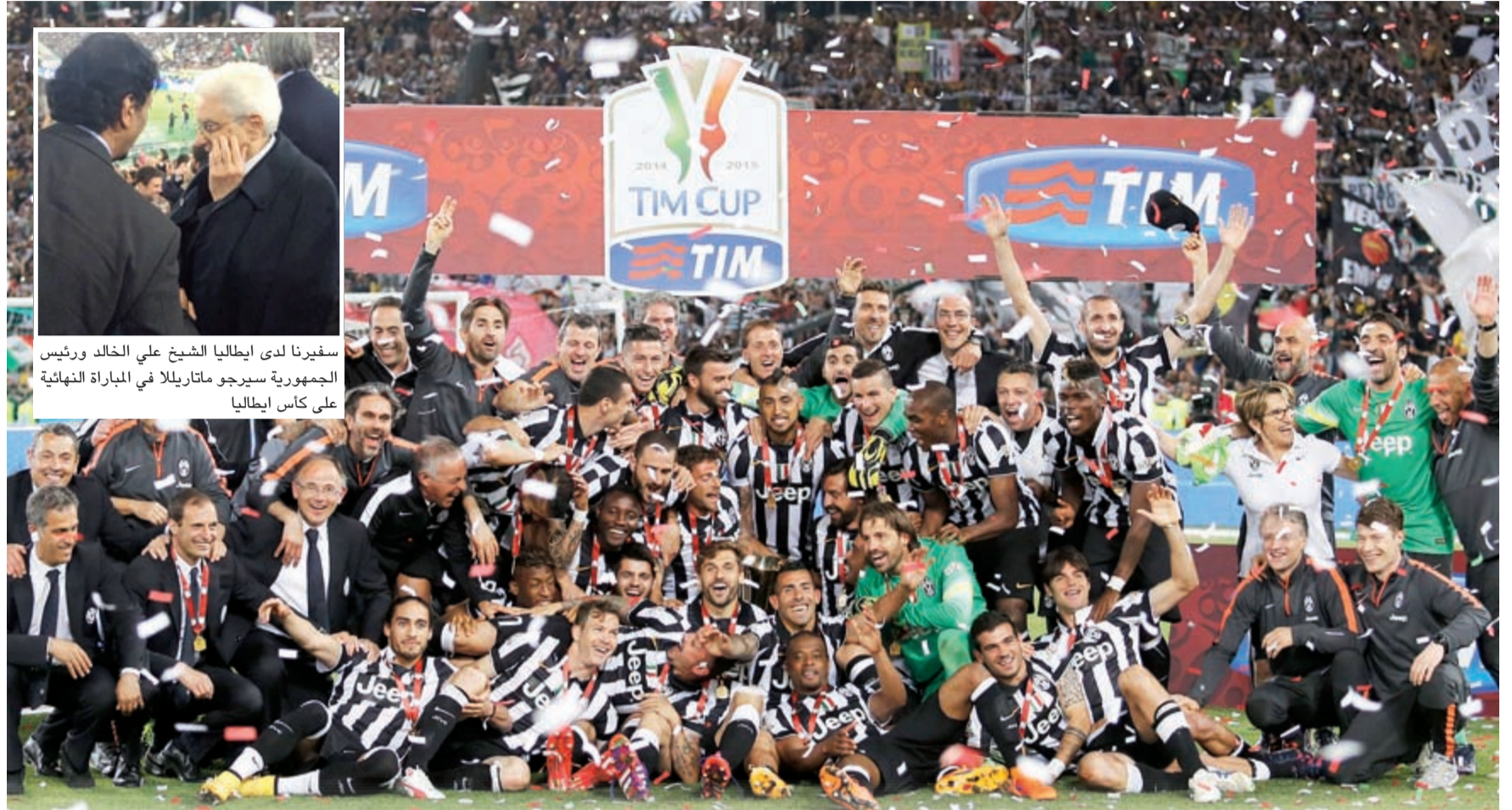
ابطال الثانية المحلية بجدارة واستحقاق