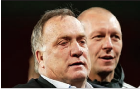
عملها الهولندي واستمر

يتابع المدرب الإسباني بيب غوارديولا المدير الفني لفريق بايرن ميونخ عن كثب وضع الهولندي لويس فان غال المدير الفني لمان يونايتد الإنجليزي، على أمل تولي مسؤولية تدريبه عقب انتهاء الموسم المقبل. صحيفة (مانشستر إيغيتنج) البريطانية أكدت أن غوارديولا يفضل تدريب اليونائيد عن تولي مسؤولية جاره مان سيتي، وأنه سيتخذ القرار النهائي بناء على وضع فان غال في الموسم المقبل. وأشار التقرير إلى أن الموسم المتبقي في عقد غوارديولا مع الفريق البافاري، سيكون بمنزلة مراقبة الأوضاع في قطبي المدينة.