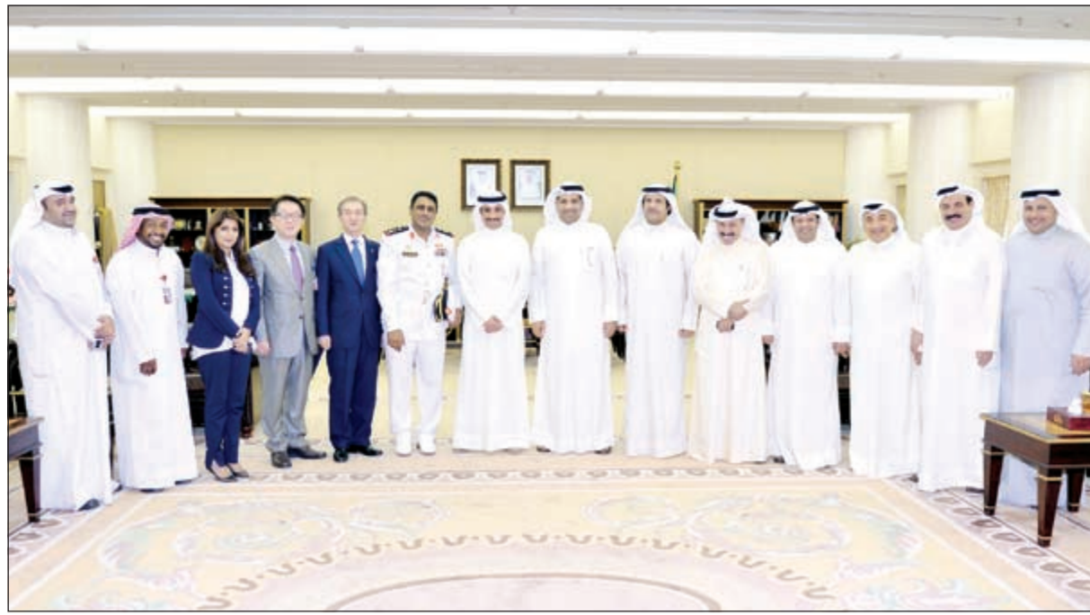
الرئيس الغانم مع رئيس المجلس الدولي للرياضة العسكرية «السيزم» والوفد المرافق له