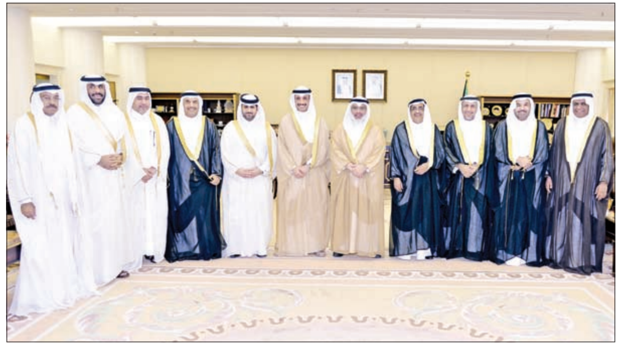
رئيس مجلس الأمة مرزوق الغانم خلال استقباله رئيس ديوان المحاسبة القطري الشيخ بندر آل ثاني والوفد المرافق له ورئيس ديوان المحاسبة بالإتابة عادل الصرعاوي

مكتب المجلس: إحالة من أمضا 30 عاماً في الخدمة إلى التقاعد