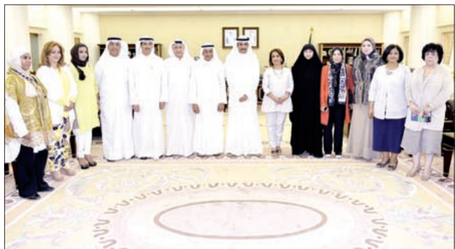
رئيس مجلس الأمة مع الجمعية الثقافية الاجتماعية النسائية