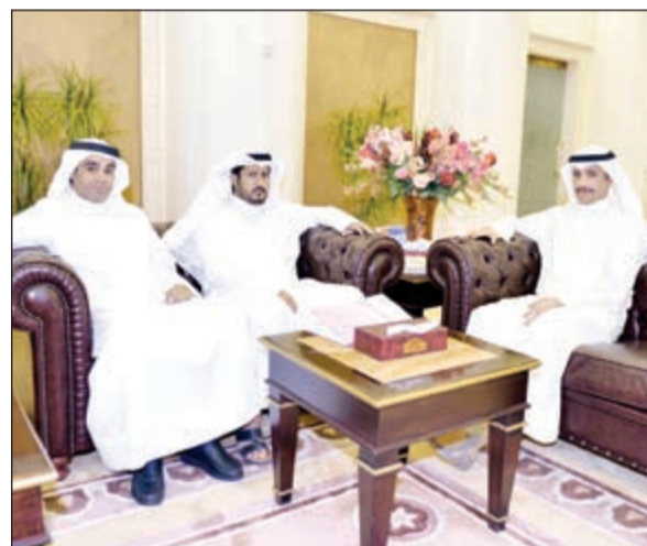
الغانم مع رئيس نقابة الجمارك ورئيس اتحاد عمال الكويت