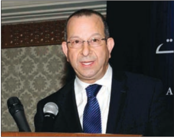
مدير عام متحدثا للحضور