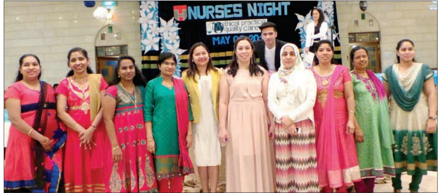
لقطة جماعية لفريق التمريض

ضمن فعاليات الأسبوع العالمي للتمريض قام طاقم التمريض في مستشفى طيبة بتنظيم يوم المرض التاسع وذلك يوم الجمعة 8 الجاري في قاعة الزمردة، وتخلل اليوم العديد من الأنشطة والفعاليات التي تتضمن عددا من الفقرات والمسابقات والعديد من المواهب الأخرى، وضم الحضور عددا كبيرا من الطاقم الطبي وطاقم التمريض من مستشفى طيبة والعيادات التابعة لها. وحول هذا السياق صرح نائب الرئيس التنفيذي لدى مستشفى راشد الفضالة قائلا: نحن في مستشفى طيبة نسعى دائما لتوفير أفضل بيئة عمل لموظفينا على اختلاف