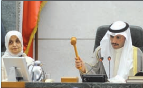
رئيس المجلس مرزوق الغانم ممسكاً بالمطرقة ويجواره وزيرة هند الصباح

سامح عبدالحفيظ - سلطان العبدان بدر السهيل - خالد الجفيل