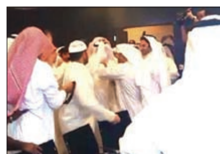
مشهد التقط أسس المشادة في الجمعية العمومية لشركة الأملية القابضة

متوسط ربح الشركة بالبورصة الكويتية الأقل خليجياً