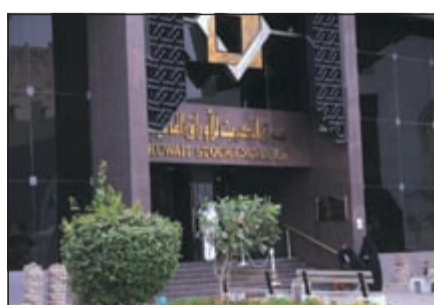
مدخل البورصة الكويتية (قاسم باشا)

متوسط ربح الشركة بالبورصة الكويتية الأقل خليجياً