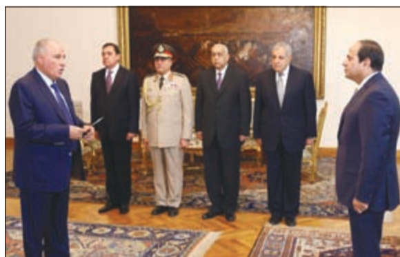
المستشار أحمد الزند وزير العدل الجديد يؤدي اليمين الدستورية أمام الرئيس المصري عبد الفتاح السيسي أمس

أحمد الزند مهامه وزيراً جديداً للعدل في مصر أمس بعد مرور تسعة أيام على استقالته سلفه بسبب تصريحات ادلى بها وأثارت موجة احتجاجات واسعة. • التفصيل ص 41