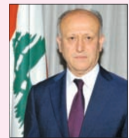
وزير العدل اللبناني أشرف ريفي

ولايتي نسي التاريخ والديمقورافيا فلا بغداد ولا دمشق ولا صنعاء أو بيروت ستكون صافية