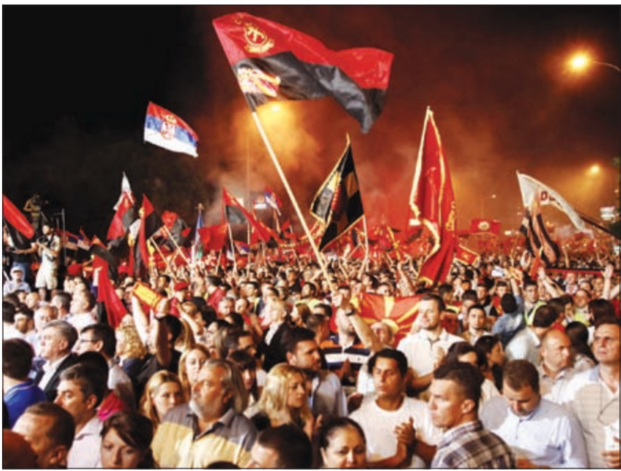
متظاهرون مؤيدون لرئيس الوزراء في مقدونيا خلال مسيرة أمام البرلمان في العاصمة سكوبيي أمس الأول

سكوبيي - أ.ف.ب: تظاهر مؤيدو المعارضة المقدونية أمس، لليوم الثالث على التوالي أمام مقر الحكومة للمطالبة باستقالة رئيس الوزراء نيكولا غروفسكي المتهم بالفساد غداة تظاهرة حاشدة لمناصري السلطة. ولبى نحو 150 متظاهراً دعوة زعيم المعارضة زوران زايف للظاهر فيما نصب نحو خمسين شخصاً من مناصري الحكومة المحافظة خيماً أمام البرلمان. وقرر متظاهرو المعارضة البقاء أمام مقر الحكومة بعد تظاهرة نظمها الأحد الماضي والتي شارك فيها أكثر من 20 ألف شخص. ويهدف هذا التحرك إلى إبقاء الضغط على الحكومة المتهمة بالفساد والتخمس غير المشروع ودفعها للاستقالة.