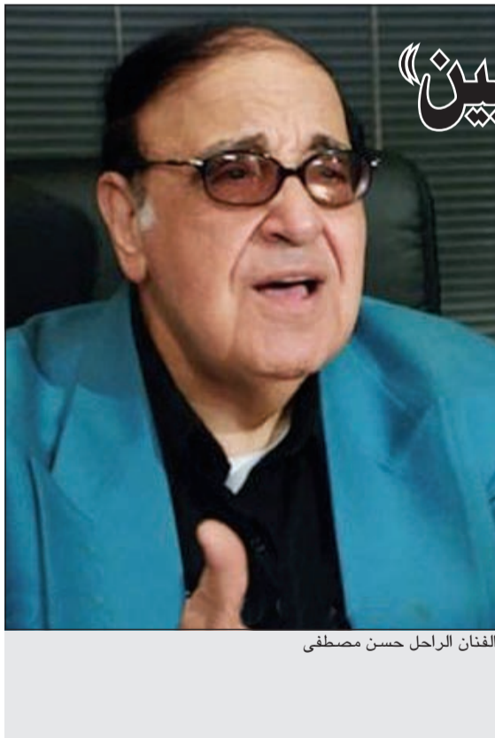
الفنان الراحل حسن مصطفى