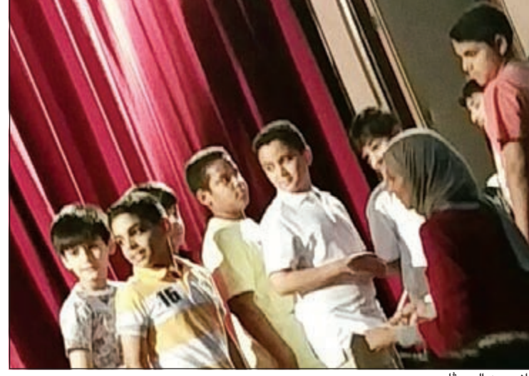
جانب من البروقات