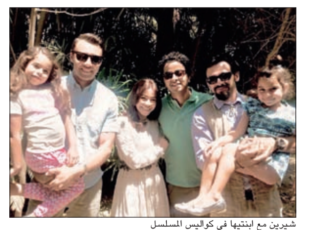
شيرين مع ابنتها في كواليس المسلسل