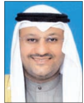
د. علي العبيدي

جنيف -كوونا: أشاد وزير الصحة د. علي العبيدي أمس بكلمة المدير العام لمنظمة الصحة العالمية د. مارغريت تشان في افتتاح أعمال الدورة الحالية للجمعية العمومية للمنظمة، مؤكداً تأييد الكويت لخطوات المنظمة في التعامل مع الحالات الطارئة والجرحة.