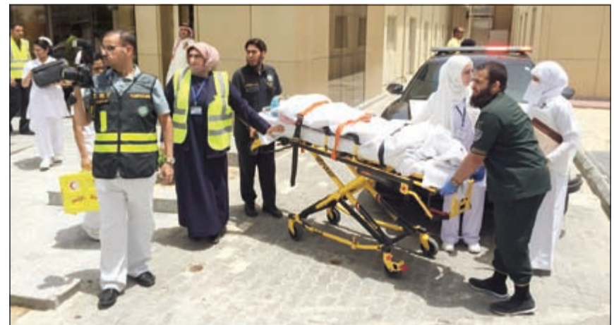
اسعاف إحدى الحالات خلال الاخلاء الوهمي

نفذت مستشفى الولادة في منطقة الصباح الطبية التخلص من إخلاء جزئياً وهمياً للجناح العاشر بالمستشفى، وذلك بالتعاون والتنسيق مع الإدارة العامة للإطفاء وإدارة الطوارئ الطبية بوزارة الصحة، والإدارة العامة للدفاع المدني، حيث تم خلال الإخلاء اسعاف 5 حالات لنساء حوامل، ونقلهن إلى مستشفيات أخرى.