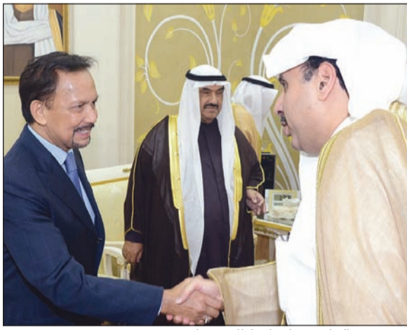
الشيخ حمد الجابر مصافحا سلطان بروناي

علي شرف صاحب الجلالة السلطان الحاج حسن البلقيية معز الدين والدولة سلطان بروناي دار السلام الصديقة والوفد الرسمي المرافق لجلالته، أقام سمو الشيخ ناصر المحمد ظهر امس مأدبة غداء، وذلك بمناسبة زيارته الرسمية للبلاد.