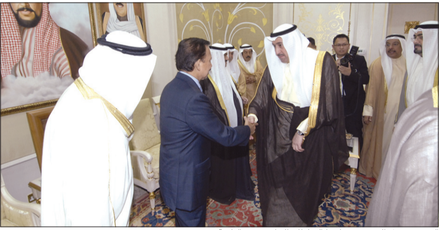
الشيخ فيصل الحمود مصافحا السلطان الحاج حسن البلقيية