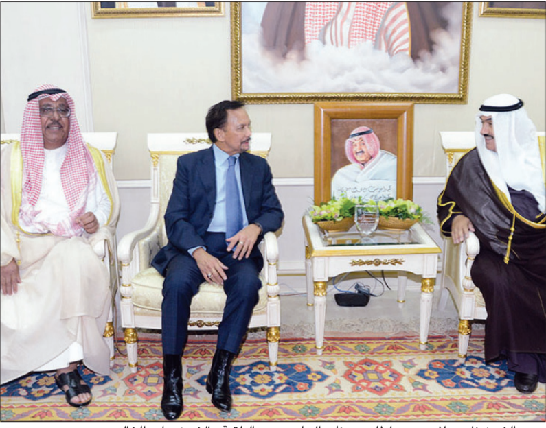
سمو الشيخ ناصر المحمد وسلطان بروناي الحاج حسن البلقيية والشيخ جابر الخالد