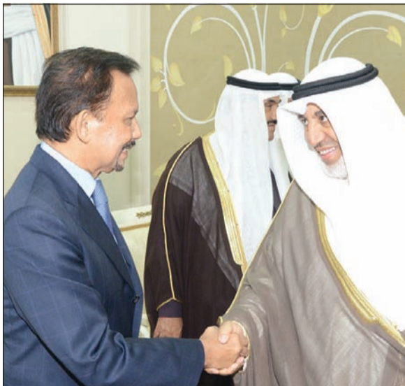
دمحمد البصري مصافحا السلطان الحاج حسن البلقيية