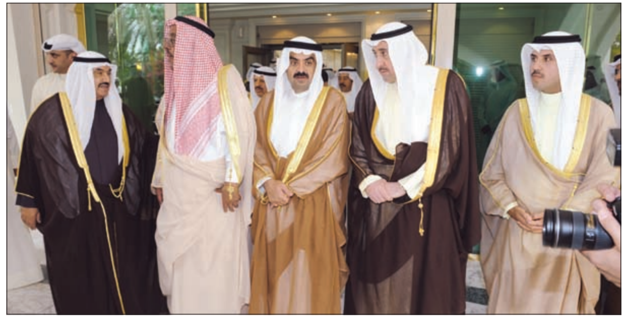
سمو الشيخ ناصر المحمد والشيخ جابر الخالد والشيخ خالد البدر والشيخ فيصل الحمود والشيخ صباح الناصر في استقبال الضيف (هاني الشمري)