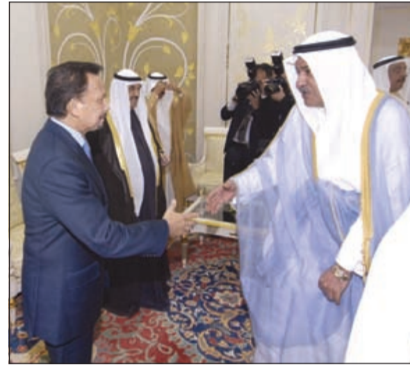
الشيخ صباح المحمد مصافحا السلطان الحاج حسن البلقية