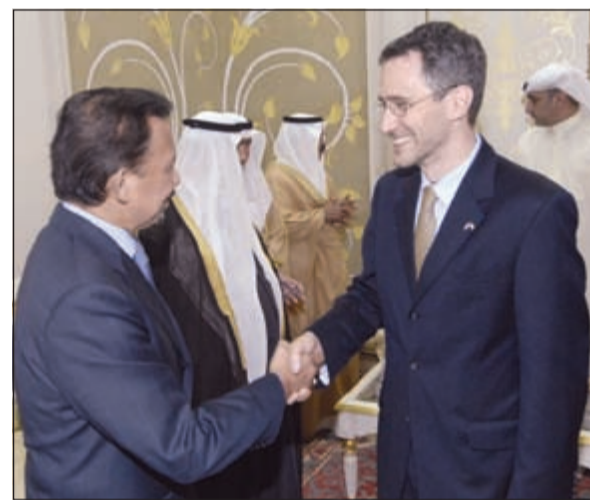
.. ومصافحة احد الدبلوماسيين