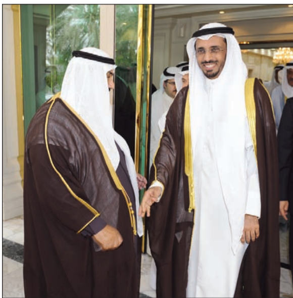
دمحمد الطبطبائي مع سمو الشيخ ناصر المحمد