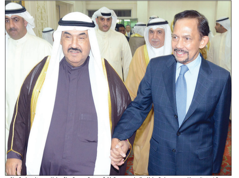
سمو الشيخ ناصر المحمد مرحبا بالسلطان الحاج حسن البلقيية معز الدين والدولة سلطان بروناي دار السلام