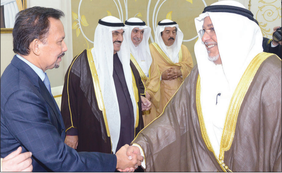
الشيخ علي الجراح مصافحا السلطان الحاج حسن البلقيية