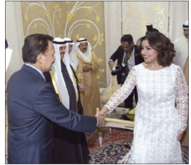
الشيخة منوف البدر مصافحة السلطان حسن البلقية