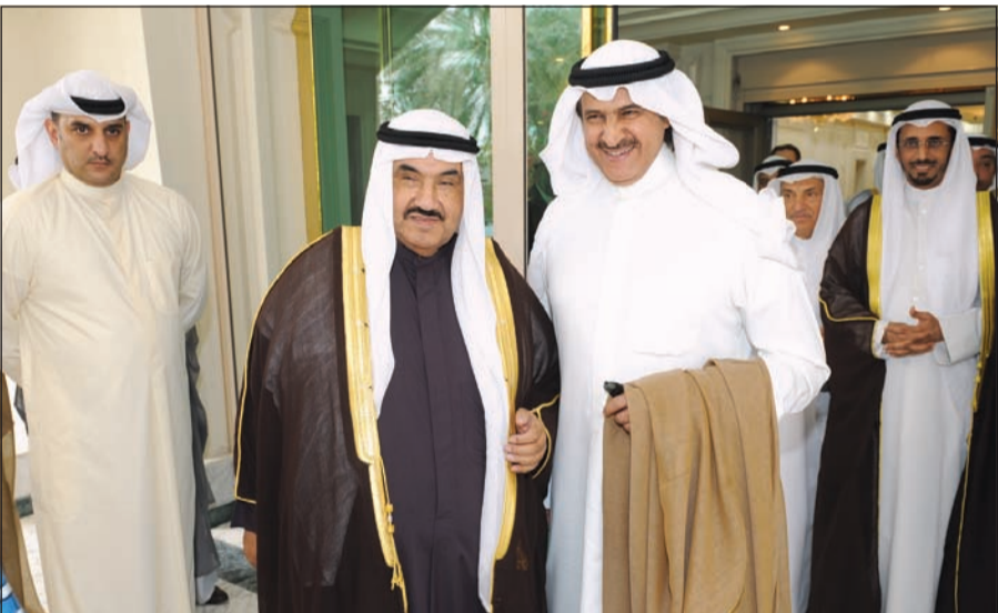
السفير ضاري العجوان وسمو الشيخ ناصر المحمد

علي شرف صاحب الجلالة السلطان الحاج حسن البلقيية معز الدين والدولة سلطان بروناي دار السلام الصديقة والوفد الرسمي المرافق لجلالته، أقام سمو الشيخ ناصر المحمد ظهر امس مأدبة غداء، وذلك بمناسبة زيارته الرسمية للبلاد.