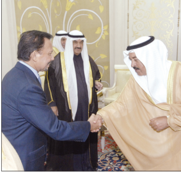
الشيخ دسالم الجابر مصافحا السلطان الحاج حسن البلقيية