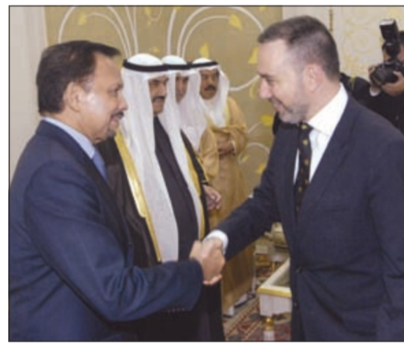
السفير الفرنسي كريستيان نخله