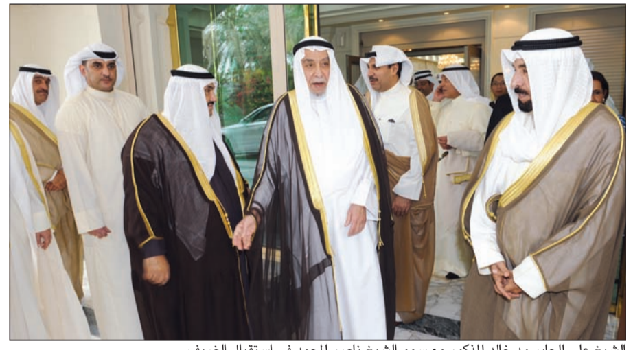
الشيخ علي الجابر ود. خالد المذكور مع سمو الشيخ ناصر المحمد في استقبال الضيف