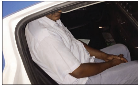
أحد الوافدين المخالفين في طريقة إلى الإبعاد