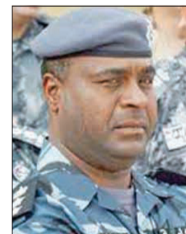
العميد عبدالله سفاح