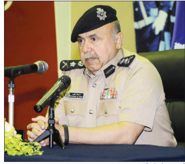
الفريق سليمان الفهد

المناط بهم. واكد الفريق الفهد على أهمية النجاح في العمل من خلال المبادرة والمتابعة، مشيرا إلى أن