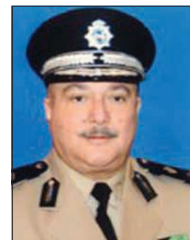
اللواء ركن شهاب الشمري