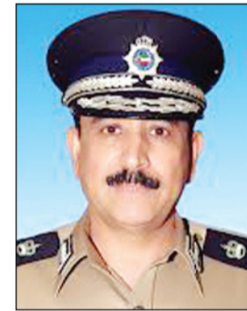
اللواء عبدالله المنها