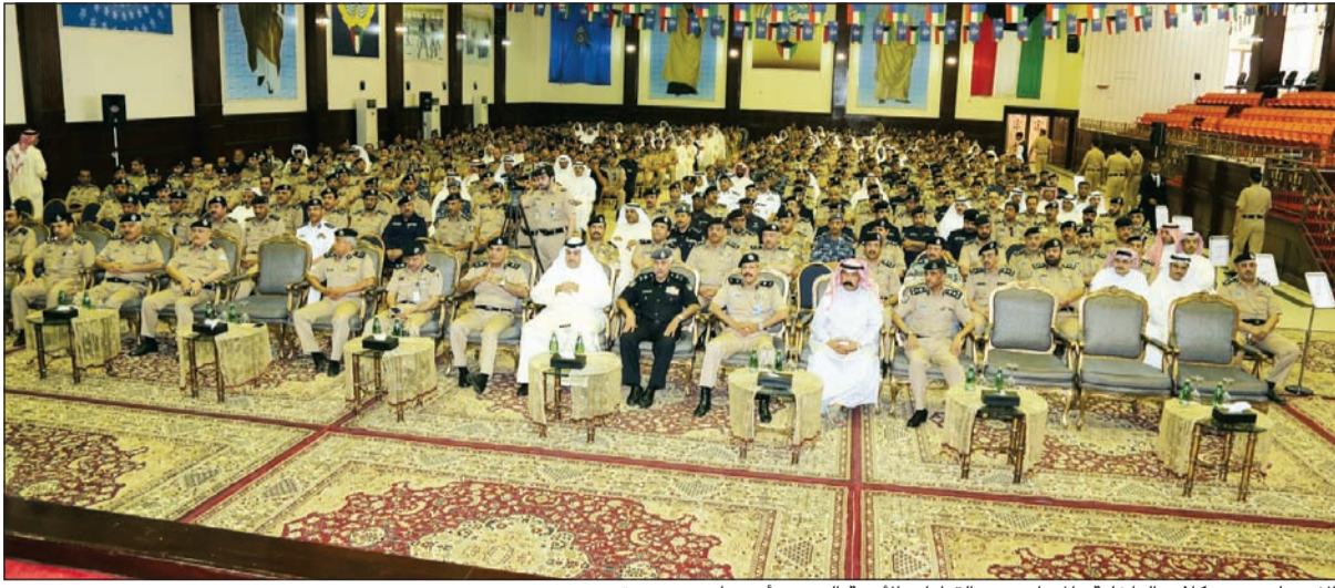
الاجتماع ضم وكلاء «الداخلية» المساعدين والقيادات الامنية التي تبوت مناصب جديدة