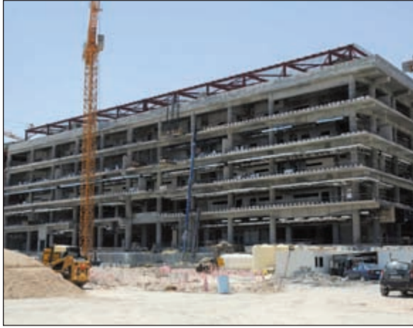
احد المباني الانشائية بالجامعة