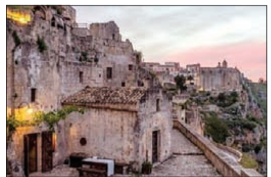
المنزل المعروضة للبيع من الداخل والخارج

ميلانو - وكالات: قررت ثلاث مدن إيطالية بيع منازل مهجورة في قرأها، بمبلغ 1,5 دولار للمنزل، وحتى مجاناً أحيانا، وذلك بعدما تحولت تلك القرى التاريخية إلى أماكن مهجورة.