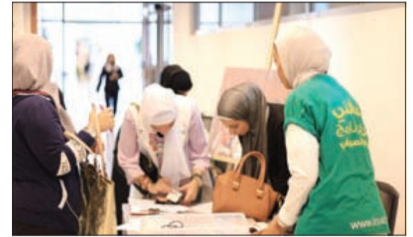
تعريف ببرنامج لويك الصيفي 2015

والكليات للتدريب في سوق العمل لمدة تتراوح بين 6 و8 اسابيع خلال فترة العطلة الصيفية في عدة شركات ومؤسسات عريقة في الكويت تتخللها ساعات تطوع محددة في مراكز تطوعية أو لجان توعوية وذلك لتعزيز الحس الإنساني وخدمة المجتمع لديهن بالإضافة الى لقاءات أسبوعية وأنشطة مختلفة وورش عمل قيمة، مبيئة مدى تأثير البرنامج الصيفي في لويك في صقل شخصية الطالبة معنوياً وذهنياً وكيف أن العمل التطوعي يخلق عند الإنسان الشعور بالوعي. وبيئت كيفية الالتحاق به عبر موقع لويك الإلكتروني وشروط الالتحاق، مشيدة بجديتهن ومثابرتهن بالعمل وهنات الكلية لوجود مثل تلك الطالبات في مؤسساتها التعليمية وشكرت إدارة الكلية على تعاونها المستمر مع المركز.