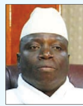
الرئيس الغامبي يحيى جامع

3 غينيا - 1972: أثناء تواجده في بريطانيا لتلقي الرعاية الطبية، أطاح الجيش بقيادة الكولونيل إنيتايوس كوتو