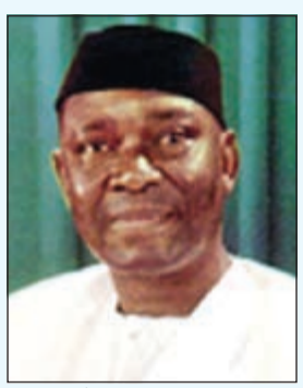
الرئيس النيجيري نامدي أزيكيوي

5 أوغندا - 1971: ميلتون أوبوتي، زعيم أوغندا الذي قاد إلى استقلالها في عام 1962 من