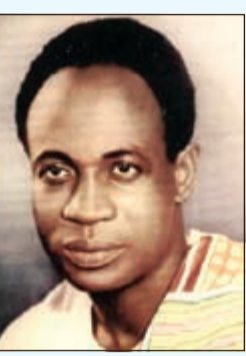
الرئيس الغاني كروماي نكروما

«محاولة الانقلاب باءت بالفشل وتم اعتقال العشرات، لقد حاولوا تدمير المؤسسات المنتخبة ديموقراطياً، بهذه الكلمات أعلن الرئيس البوروندي بيير نكورونزيزا، في خطاب جماهيري أمس الأول فشل الانقلاب عليه عندما كان مسافراً إلى تنزانيا لحضور قمة قادة دول شرق إفريقيا، ليكتب بذلك الفصل الأخير في رواية الانقلاب الحادي عشر على رئيس أفريقي مسافر خارج بلاده، حيث أنه قد خبر 10 رؤساء أفارقة طعم الانقلاب على حكمهم خلال تواجدهم في غير بلدانهم الأصلية، في حوادث تبدو شبيهة بما حدث، في بوروندي، والتي رغم فشلها إلا أنها تضاف إلى سيرة بنايات أضحت على مر السنين تقليداً إفريقياً بامتياز، وفيما يلي أسماء وتواريخ الانقلابات على الرؤساء