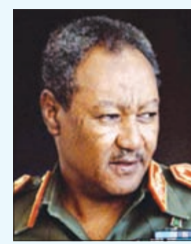
الرئيس السوداني جعفر نميري

2 غانا - 1966: انتهت القادة العسكريون فرصة وجود الرئيس