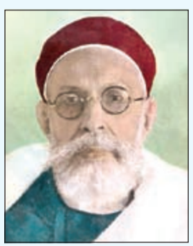
الملك محمد إدريس السنوسي

لإسقاط الملكة الليبية، وإعلان نشوء الجمهورية العربية الليبية، حيث تشكلت حركة الضباط الوجوديين الأحرار في الجيش الليبي بقيادة الملازم أول معمر القذافي،