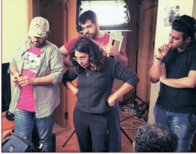
المخرجة هيفاء المنصور مع فريقها الفني تتابع عملية التصوير