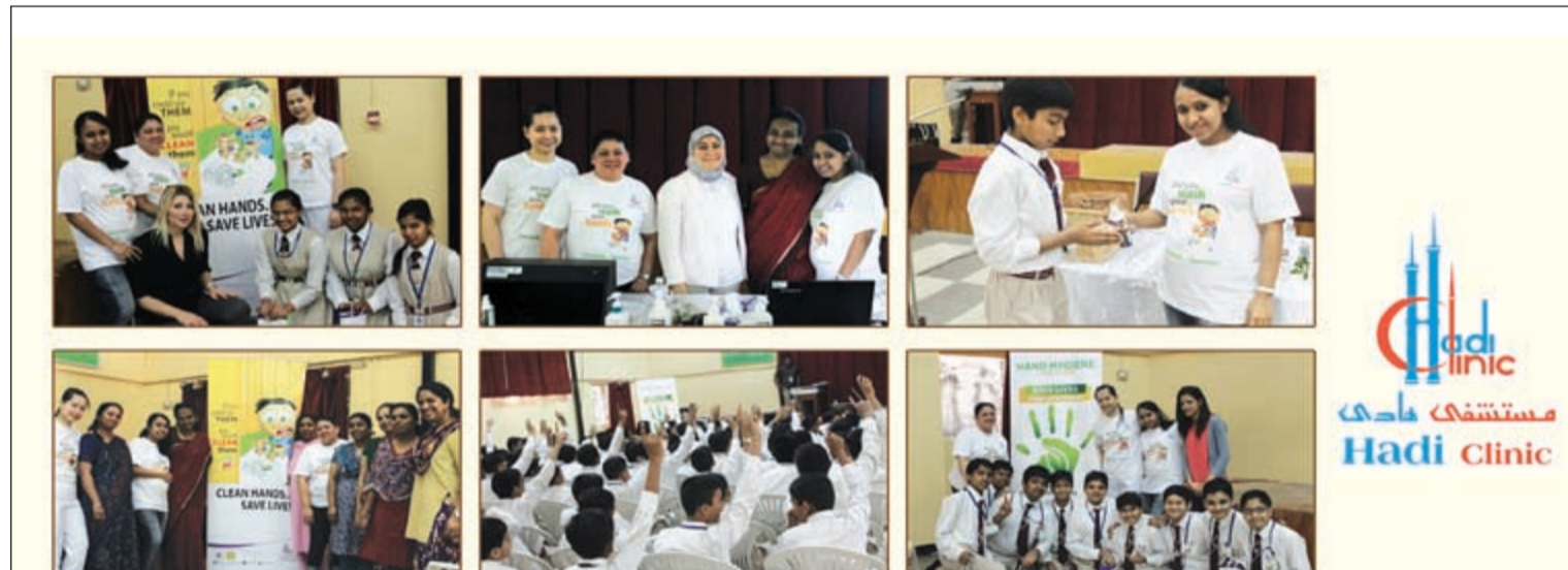
لقطات من الحملة التوعوية لمستشفى هادي حول نظافة اليدين في عدد من المدارس

الماء والصابون عند اتساخهما أو تلوثهما بالدم أو بوسائل الجسم الأخرى بشكل ظاهر للعيان، أو بعد استخدام المرحاض أو أثناء إعداد الطعام. من جهته، قال د.زيد الخالدي: إن غسل اليدين هو حملة ترمي إلى حث الأفراد على غسل أيديهم وذلك لأهمية النظافة بوصفها عاملا أساسيا في الوقاية من الأمراض المعدية التي تنتقل عن طريق الأيدي، استنادا للدراسات العلمية لمنظمة الصحة العالمية. وأضاف أيضا أن اليدين غير المغسولتين تتقلان مسببات المرض للشخص ذاته أو لشخص آخر عبر الأغشية المخاطية بمجرد لمس الوجه أو تناول الطعام، لذا أكد على أهمية الغسل الدائم المنتظم للأيدي بعد دخول المرحاض وبعد الرشح وقبل الأكل ووضع مستحضرات التجميل للوقاية من العدوى، موضحا أن غسل اليدين بالماء والصابون ينبغي أن يستغرق مدة لا تقل عن 20 ثانية. وتخللت المحاضرة عدة أنشطة شارك فيها الأطفال كما قاموا بعبء تجارب عن كيفية غسل اليدين بالطريقة الصحيحة، وفي الختام تم توزيع الهدايا المقدمة من قبل مستشفى هادي أضافت الفرحة والبهجة على وجوه حاضرين. وتأتي هذه الحملة التوعوية ضمن استراتيجية إدارة مستشفى هادي في نشر التوعية للجميع وهذا غير جديد على مستشفى هادي الذي طالما عودنا عن مشاركاته الفعالة في كل المجالات.