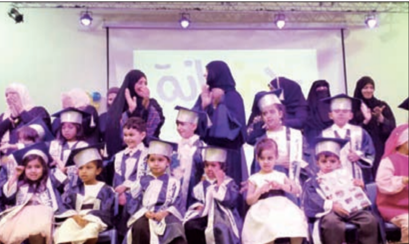
براعم حضانة الفصحى في اجواء التخرج

واختتم الحفل بتكريم الخريجين على انغام وأناشيد الفرحة والنجاح سائلين المولى عز وجل أن يجعل هذا الجيل من خير رجال ونساء الأمة الإسلامية.