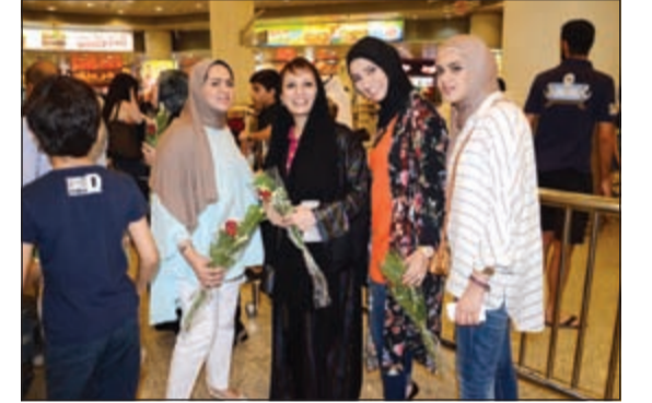
الرئيس وعضاء اللجنة الاجتماعية