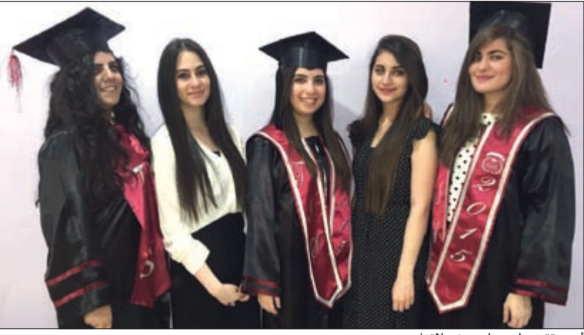
أريج تتوسط عددا من زميلاتها