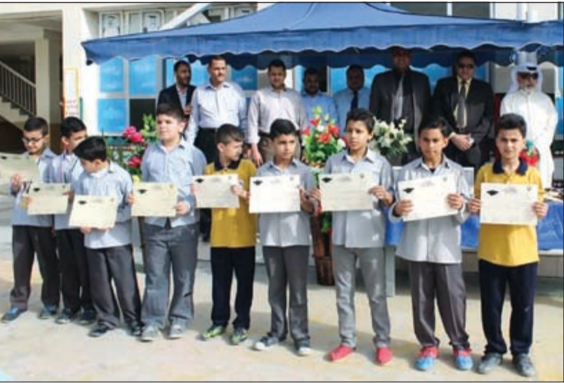
عدد من الطلبة المكرمين