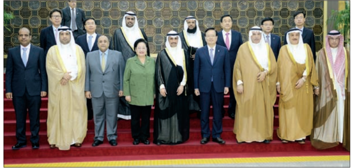
لقطة تذكارية للوفد البرلماني مع رئيس البرلمان الكوري الجنوبي