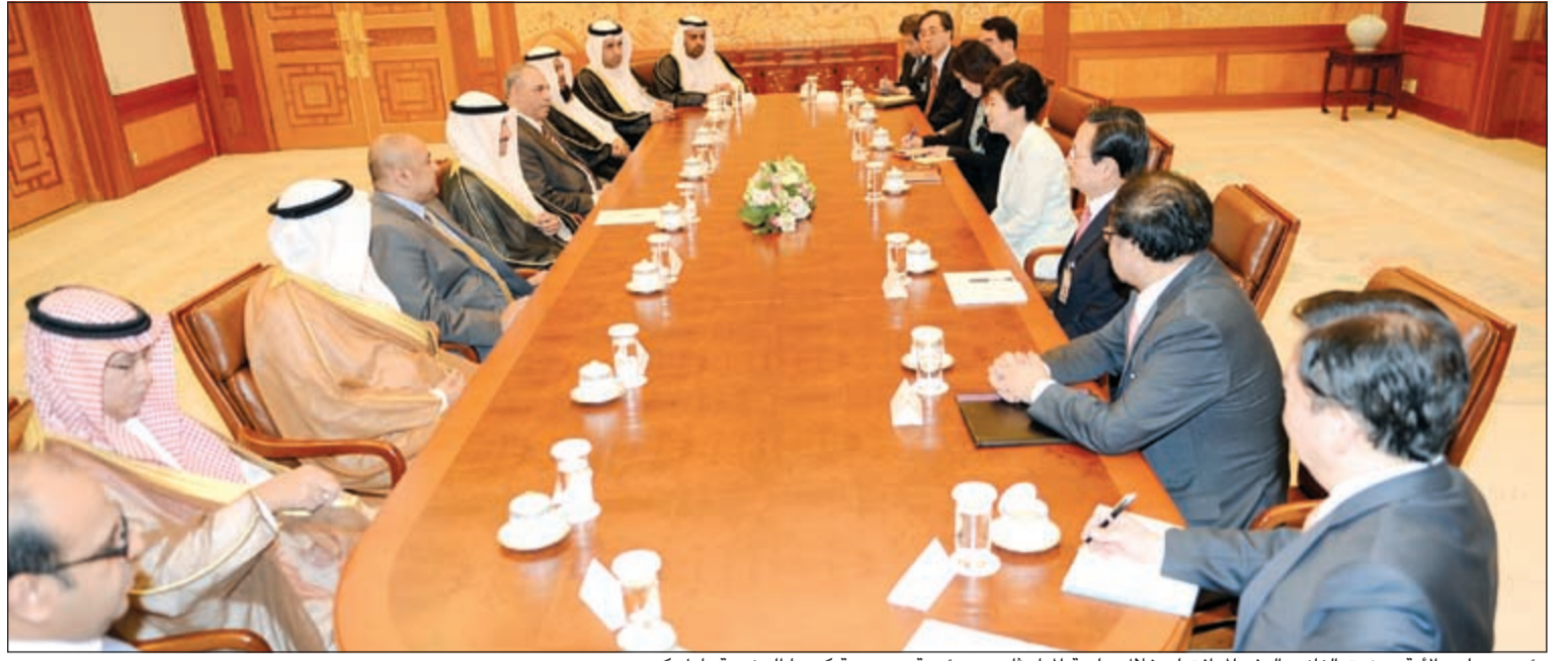
رئيس مجلس الأمة مرزوق الغانم والوفد المرافق له خلال جلسة المباحثات مع رئيسة جمهورية كوريا الجنوبية بارك كيون هيه

التقى والوفد البرلماني المرافق له رئيسة الجمهورية ورئيس البرلمان