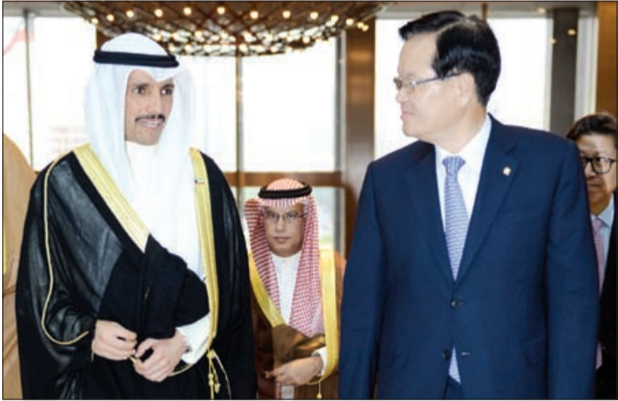
الغانم وجانغ إي إهيو

أكد رئيس مجلس الأمة مرزوق الغانم ان الكويت تولي اهتماما بالغا بتطوير علاقاتها مع جمهورية كوريا الجنوبية التي تعد أكبر مستورد للنفط الكويتي، مشيرا الى ان الشراكة الاقتصادية بين البلدين «شراكة قديمة وتاريخية». جاء ذلك في تصريح أدلى به لقناة المجلس و«كونا» امس عقب مباحثاته الرسمية مع رئيسة جمهورية كوريا الجنوبية بارك كيون هيه ورئيس البرلمان جانغ إي إهيو في إطار زيارته الحالية الى العاصمة سيئول. وقال الغانم انه بحث مع رئيسة الجمهورية ورئيس البرلمان