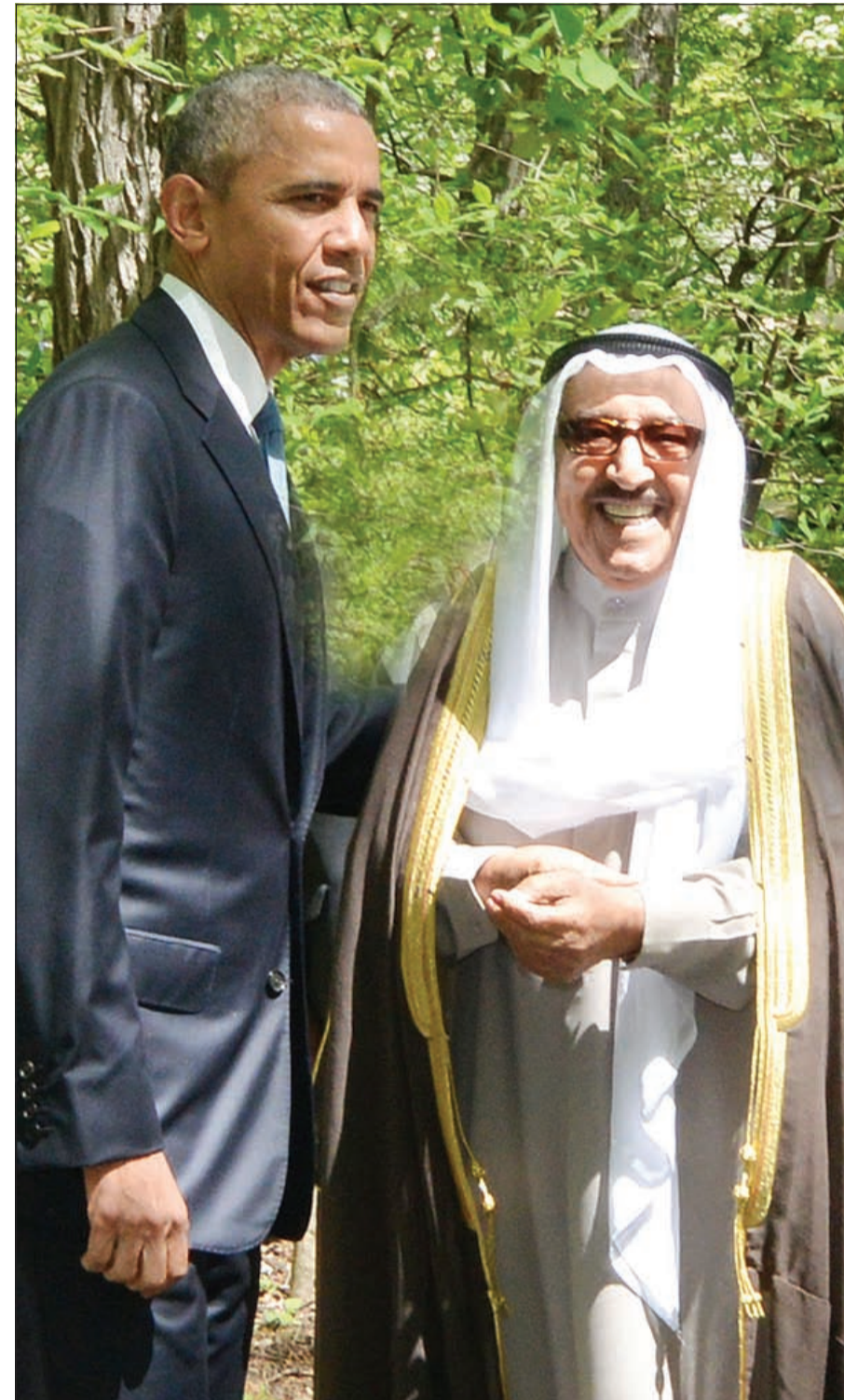
الرئيس الأميركي باراك أوباما مرحبا بصاحب السمو الأمير الشيخ صباح الأحمد في كامب ديفيد