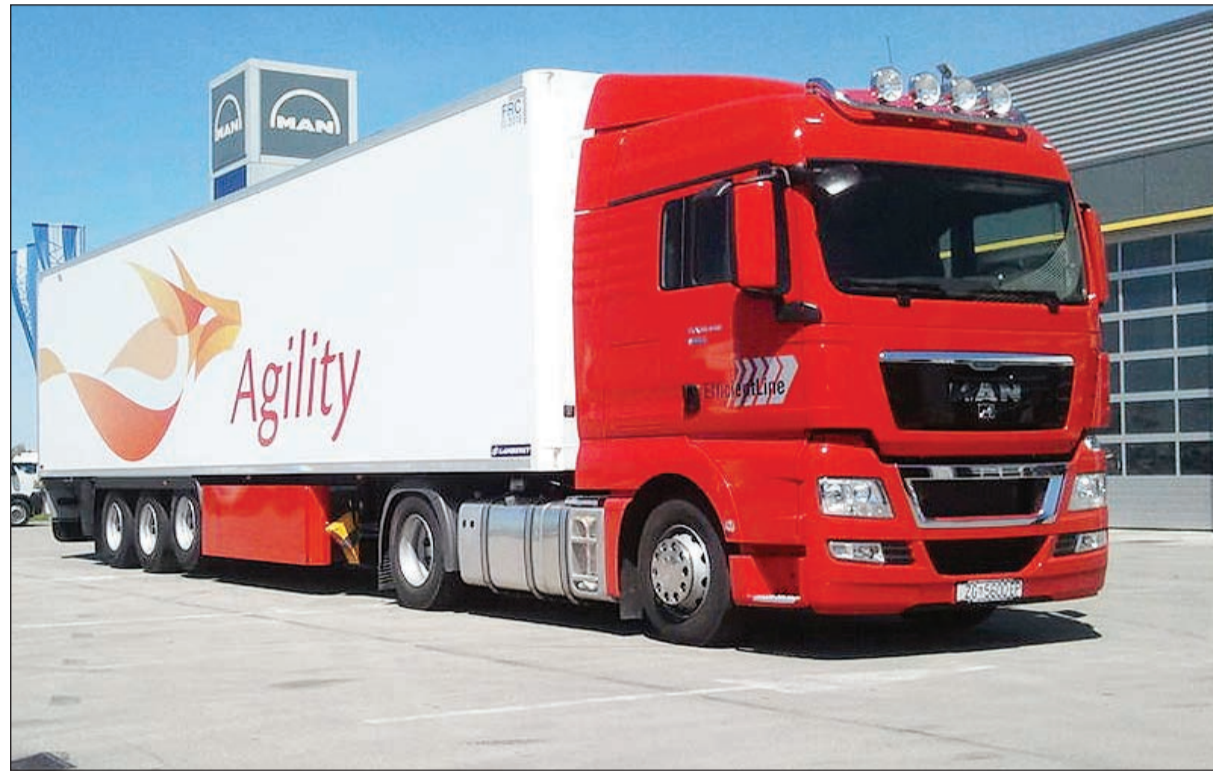
شركة أجيليتي تصدرت قائمة أكبر الشركات الصناعية حجما وأرباحا وإيرادات خلال 2014 ويشكل حجمها 33% من حجم القطاع