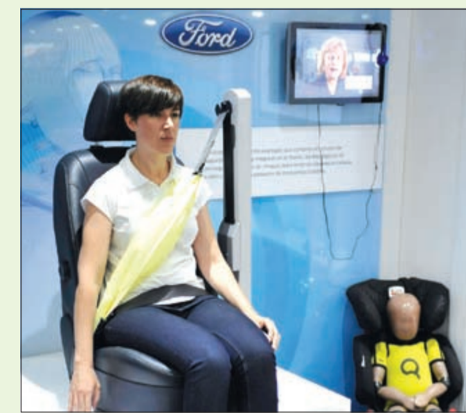
تفتح حزام الأمان

مع نمو طفلك، يجب تغيير كرسي أمان الأطفال تماشياً مع وزنه وطولهم من أجل الحرص على أن يعمل كما يجب. عند إجلال طفلك في السيارة، استخدم نظام LATCH - المتوافر في كل مركبات فورد ولينكولن - لتثبيت كرسي الأمان، ولا تضعي أبداً طفلاً في مقعد مواجه للخلف في الجهة الأمامية للسيارة، عندما تكون الوسادة الهوائية نشطة. يجب دائماً أن يجلس الأطفال ما دون 13 سنة في المقعد الخلفي، وإذا توجب أن يجلس طفل أكبر سناً في المقعد الأمامي، ينبغي