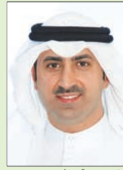
الشيخ نمر الصباح