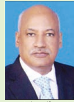
السفير عبدالكريم سليمان