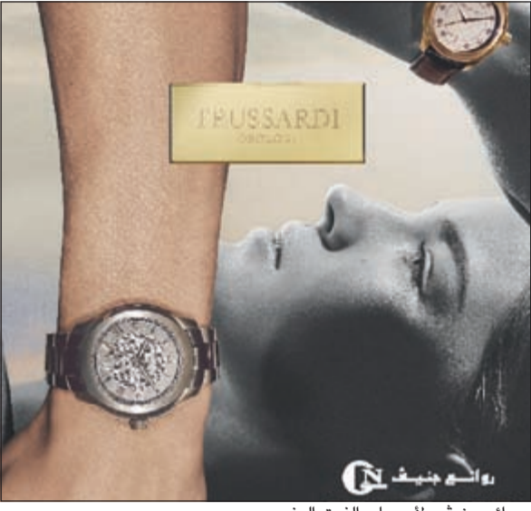
«روائع جنيف» لأصحاب الذوق الرفيع