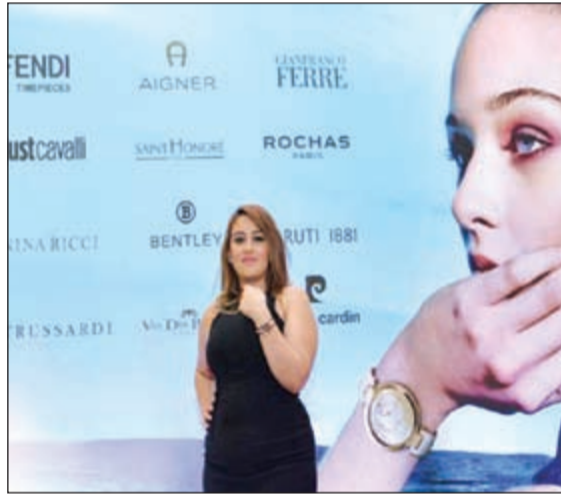
ديانا.. وعرض مميز