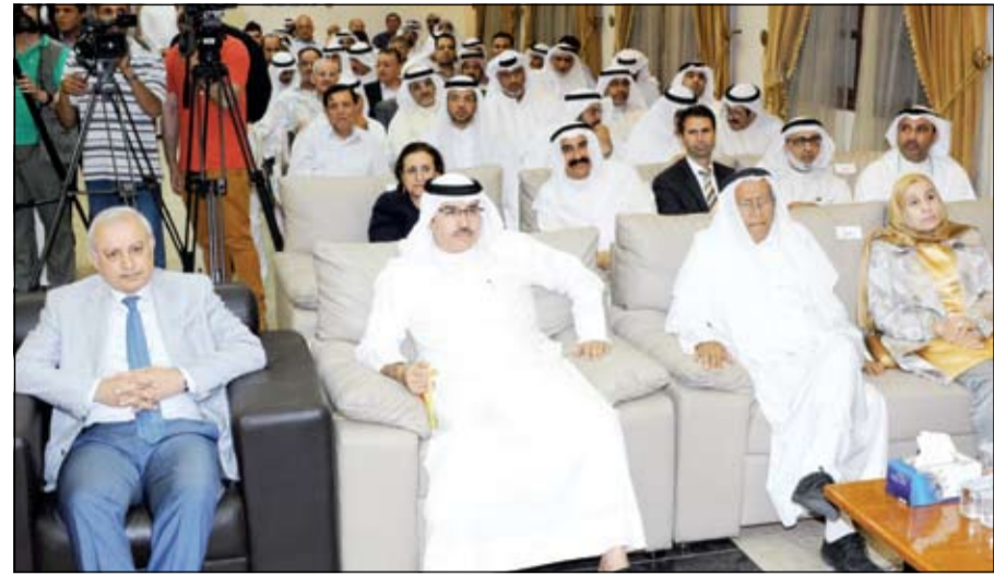
د. بدر العيسى ود. حياة الحجى ود. عواد الظفيري

أكد وزير التربية ووزير التعليم العالي د.بدر العيسى أنه ليس في حاجة إلى الاستعجال بالإعلان عن مدير جديد للجامعة، مشيرا إلى أن د.حياة الحجى مديرة الجامعة مازالت على رأس عملها وتؤدي واجبها. جاء ذلك خلال حفل الاستقبال والتكريم الذي نظمه أعضاء الهيئة الادارية في جمعية أعضاء هيئة التدريس بجامعة الكويت، مضيفا أن «الكوادر موقوفة في جميع الوزارات والبديل الإستراتيجي من الممكن أن يحل العديد من الأمور مستقبلا، ونحن نعلم معاناة أعضاء هيئة التدريس وفي الأيام المقبلة ستتحسن ظروفهم وسنزيد من امتيازاتهم»، متمنيا التعاون بين الجمعية والإدارة الجامعية في تحقيق جميع مطالب الاساتذة التي تعزز دورهم. من جانبه، أعلن النائب خليل أبل عن تقديمه اقتراحا بقانون الجامعات الحكومية قريبا وهو قانون يختص بإلغاء جميع القوانين الخاصة بالمؤسسات الأكاديمية والاعتماد على قانون موحد لها وذلك لتسهيل العملية التعليمية.