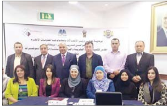
عدد من الحضور خلال المؤتمر

وقد ناقش المؤتمر مجموعة من المحاور الرئيسية منها: الطريق إلى الحكومة الذكية واستراتيجيات نجاحها، التحول من الإدارة الالكترونية إلى الإدارة الذكية، والذي عقد في الفترة من 3 إلى 7 مايو الجاري في عمان بالأردن بمشاركة مع مركز أطلس لتنمية الموارد البشرية ومركز لندن للتدريب المتميز -بريطانيا وبالتعاون مع بترال للمؤتمرات وويدوز النوافذ للاستشارات الفنية والإدارية.