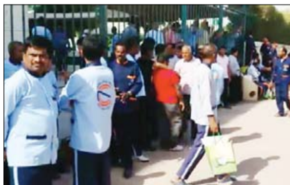
جانب من اعتصام العمال والمراسلين

الى نائب المدير العام للشؤون المالية والإدارية اللذين رفضا مقابلتهم، طالبوا بضرورة تدخل المسؤولين عن التعليم لإنهاء هذه المشكلة التي عجز عن حلها قياديو الهيئة. وأشار عمال النظافة والمراسلون إلى أنهم سيواصلون الإضراب حتى صرف مستحققاتهم المالية، لافتين إلى ان الهيئة تضع اللوم على الشركة المشرفة على عقودهم.