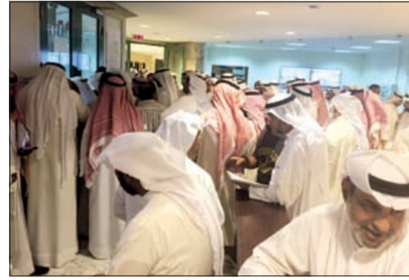
جانبا من تدافع المواطنين في مبنى «السكنية»

الى شهادة سجل عقاري حديثة من وزارة العدل، مبينا فيها الرقم المدني وصور البطاقات المدنية لأفراد الأسرة وفي حالة وفاة أب صاحب العلاقة عليه إحضار شهادة سجل عقاري حديثة للمرحوم بالإضافة إلى شهادة حصر الورثة وشهادة حديثة من الهيئة العامة لشؤون ذوي الإعاقة للمشمولين بقانون 8 لسنة 2010 في شأن حقوق الأشخاص ذوي الإعاقة وفي حالة التغيير في الاسم يجب إحضار الكتب بالاسم القديم والجديد بالنسبة للزوج والزوجة.