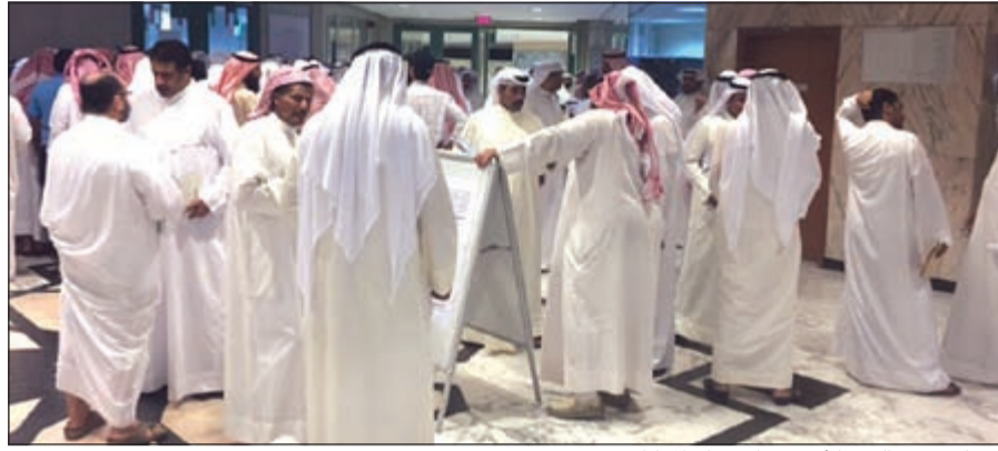
عدد كبير في اليوم الأول من استقبال المواطنين