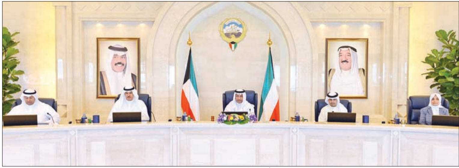
سمو رئيس الوزراء مترئسا جلسة مجلس الوزراء بحضور الشيخ سلمان الحمد وأنس الصالح ود.علي العبيدي وهند الصباح

ثم اطلع مجلس الوزراء على محضر اللجنة الدائمة لشؤون الشباب بشأن توصية اللجنة لاعتماد إستراتيجية الرياضة الكويتية من منظور خطة التنمية، وقرر تكليف الهيئة العامة للشباب