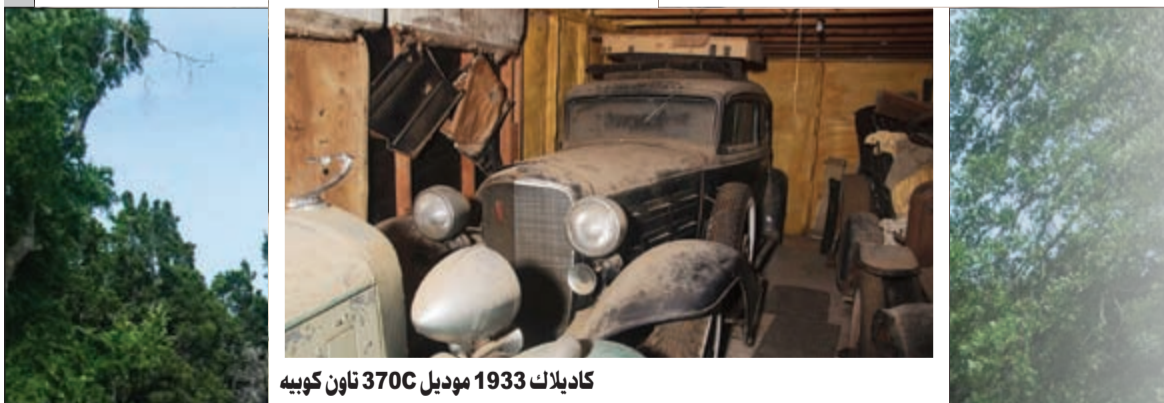
كاديلاك 1933 موديل 3700 تاون كوبيه