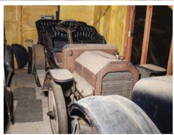
ريو 1908 موديل G Boattail