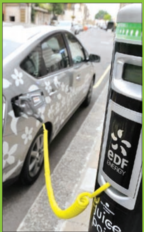
شعبية متزايدة بين المشترين الأوروبيين

برلين - د.ب.أ: أظهرت بيانات حديثة أن السيارات التي تعمل بمصادر الطاقة البديلة مثل المحركات الكهربائية تحقق شعبية متزايدة بين المشترين الأوروبيين. ووفقاً لبيانات اتحاد منتجي السيارات الأوروبي فإن الربع الأول من العام الحالي شهد زيادة في مبيعات السيارات الكهربائية والهجين التي تعمل بكل من الكهرباء والوقود التقليدي في دول الاتحاد الأوروبي السبع والعشرين بنسبة 28,8% مقارنة بالفترة نفسها من العام الماضي.