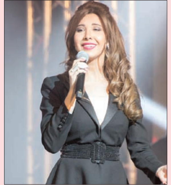
نانسي عجرم في الحفل

لنانسي «سنة حلوة يا جميل»، فشكرتهم وهي متأثرة بهذه المحبة التي أحاطها بها محبوبها في الكويت. وأكملت عجرم فقرتها وقدمت أغنية «شيخ الشباب»، ثم اتبعها بأغنية «مشناقة» لبيك، لتتدو بعد ذلك بأغنية «جاي أودعك»، وألحقتها بـ «أخاصمك اه» والتي تغافل معها الحضور بشكل كبير، شددت بعدها بأغنية «شيل عيونك عني»، ثم «لون عيونك»، وقدمت مقطعا واحدا من أغنية «لغيت حالي بالكويت»، ثم غنت «يا كتر»، و«اه ونص»، وأعقبتها بـ «يا طيب»، ثم «يا بنات»، وأنتهت وصلتها بأغنية «ماشي حدي»، لتسدل الستار على ليلة غنائية ناجحة.