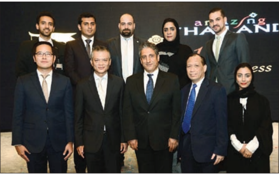
الوزير المفوض بسفارة مملكة تايلاند في الكويت كورن سواناسي ومدير مكتب هيئة السياحة التايلاندية في دبي والشرق الأوسط تشالمارسك سورانات والمدير العام لمكاتب الاتحاد للطيران التجارية في الكويت نبيل متاروه في لقطة جماعية