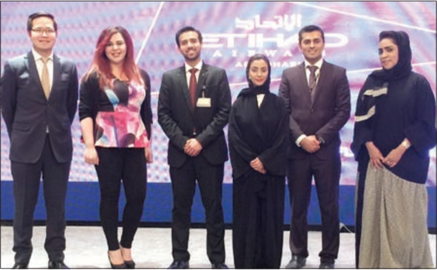
فريق عمل الاتحاد للطيران ومكتب هيئة السياحة التايلاندية في دبي والشرق الأوسط

قدمت الاتحاد للطيران، الناقل الوطني لدولة الإمارات العربية المتحدة، الدعم لهيئة السياحة التايلاندية (TAT) خلال العروض التي قدمتها الجولة الترويجية التايلاندية في مدينة الكويت. وحضر العرض الترويجي، الذي أقيم مؤخرا في قاعة الجبراء في فندق الـ «جني بيليو ماريوت»، في مدينة الكويت العديد من كبار الشخصيات والمسؤولين، ونقدمهم كورن سواناسي، وزير مفوض سفارة