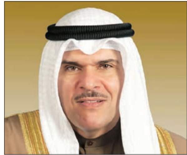
الشيخ سلمان الحمود

العالم بالإضافة لدعمها العمل الإنساني والجهود الخيرية في كل مكان. وشدد الحمود على الأهمية الكبيرة لهذه الصبغة والصورة التي تترجم ما جبل عليه الكويتيون من قيم الخير والتواصل والتي حظيت باعتراف العالم وتوحيه بتكريم الأمم المتحدة للكويت كمركز للعمل الإنساني وإطلاق لقب «قائد العمل الإنساني» على صاحب السمو الأمير الشيخ صباح الأحمد. أما الرسالة الثالثة فينبغي للحمود أنها «رسالة تخصصية» في إطار موضوع الإكسبو الذي اختارته إيطاليا عنواناً