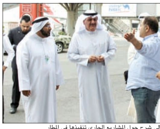
الوزير الكندري يستمع إلى شرح حول المشاريع الجاري تنفيذها في المطار