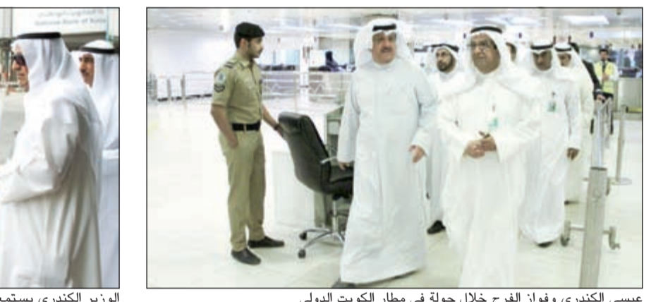
عيسى الكندري وفوزان الفرح خلال جولة في مطار الكويت الدولي

الرادار المتابعة سير العمل فيها. ورافق الوزير الكندري في جولته بالمطار رئيس الإدارة العامة للطيران المدني فوزان عبدالعزيز الفرح وكيار المسؤولين في الطيران المدني والإدارة العامة لأمن المطار التابعة لوزارة الداخلية.