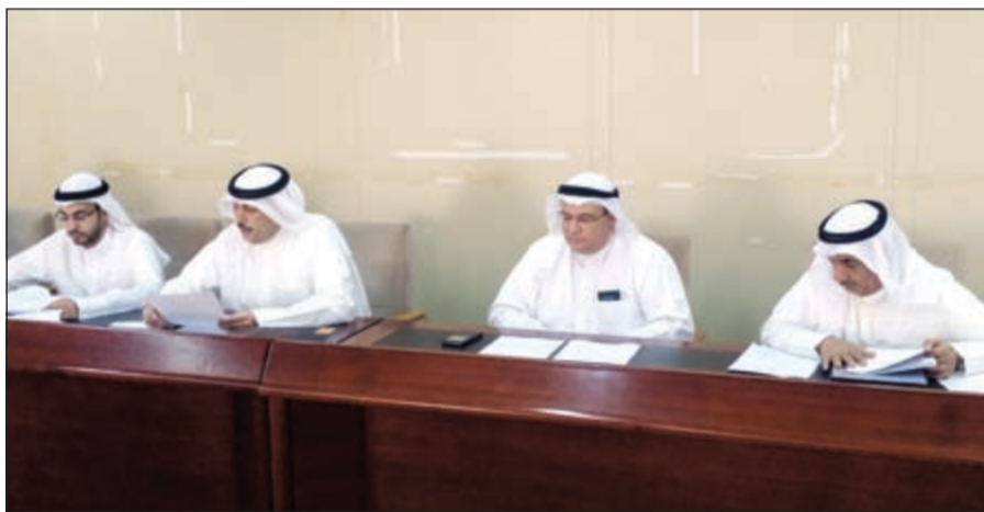
جانب من عمومية «المساكن»

الخالد ان الشركة تسعى من خلال مشاريعها الحالية الى تحقيق عدد من الأهداف الأساسية وهي تعظيم حقيق المساهمين وتحقيق نمو في الأرباح السنوية بالإضافة الى تحقيق عوائد مجزية للمساهمين.