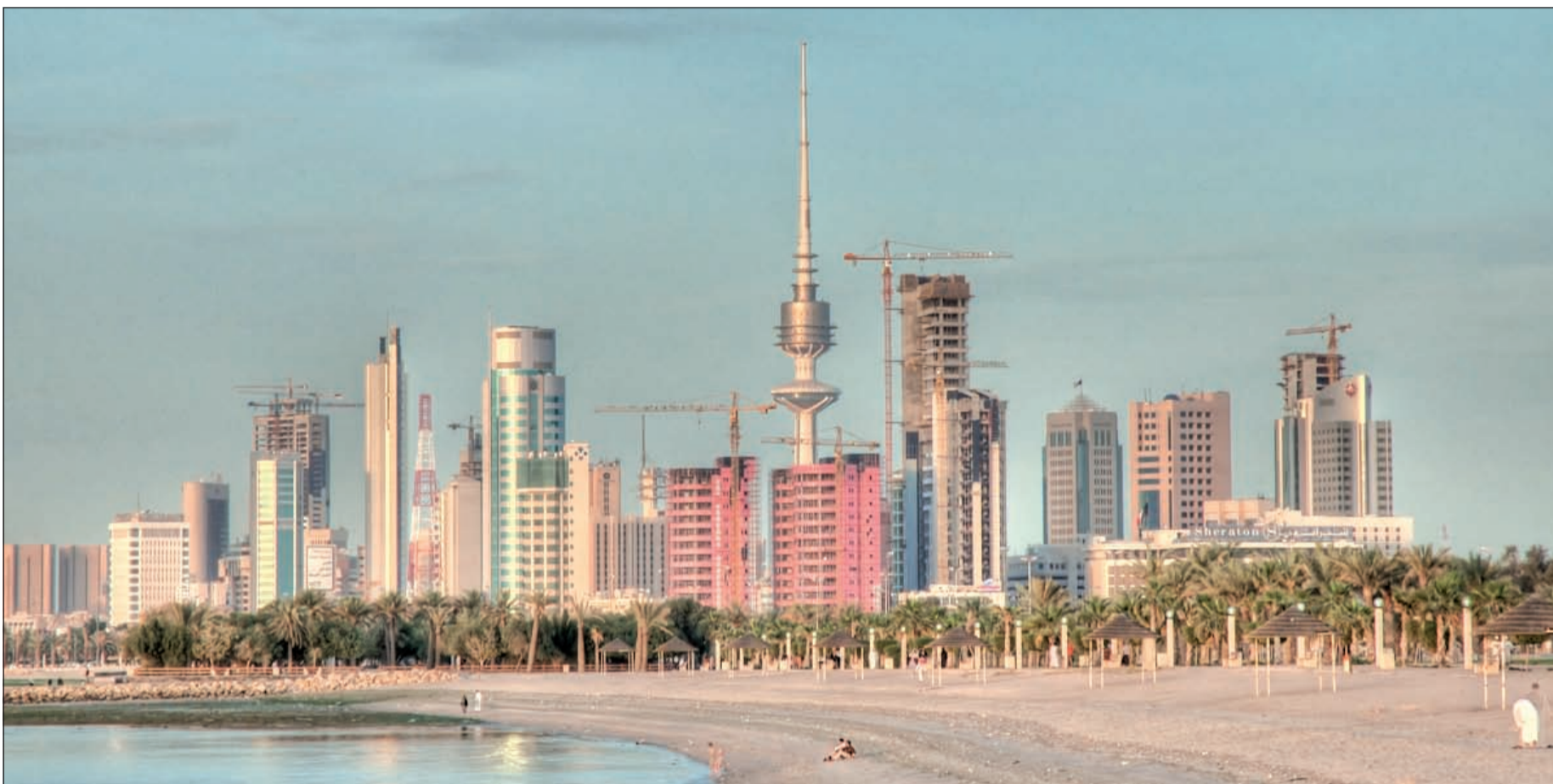
1,7% نمو الناتج المحلي المتوقع للكويت في 2015.. و3,3% معدل التضخم في 2015