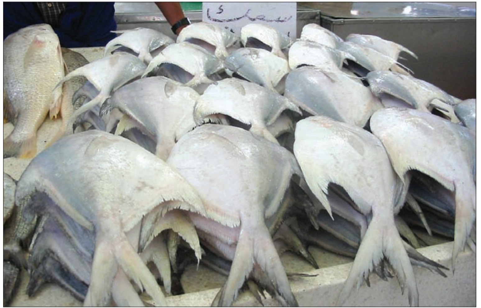
أسماك الزبيدي، قفزت ثلاثة أضعاف العام الماضي