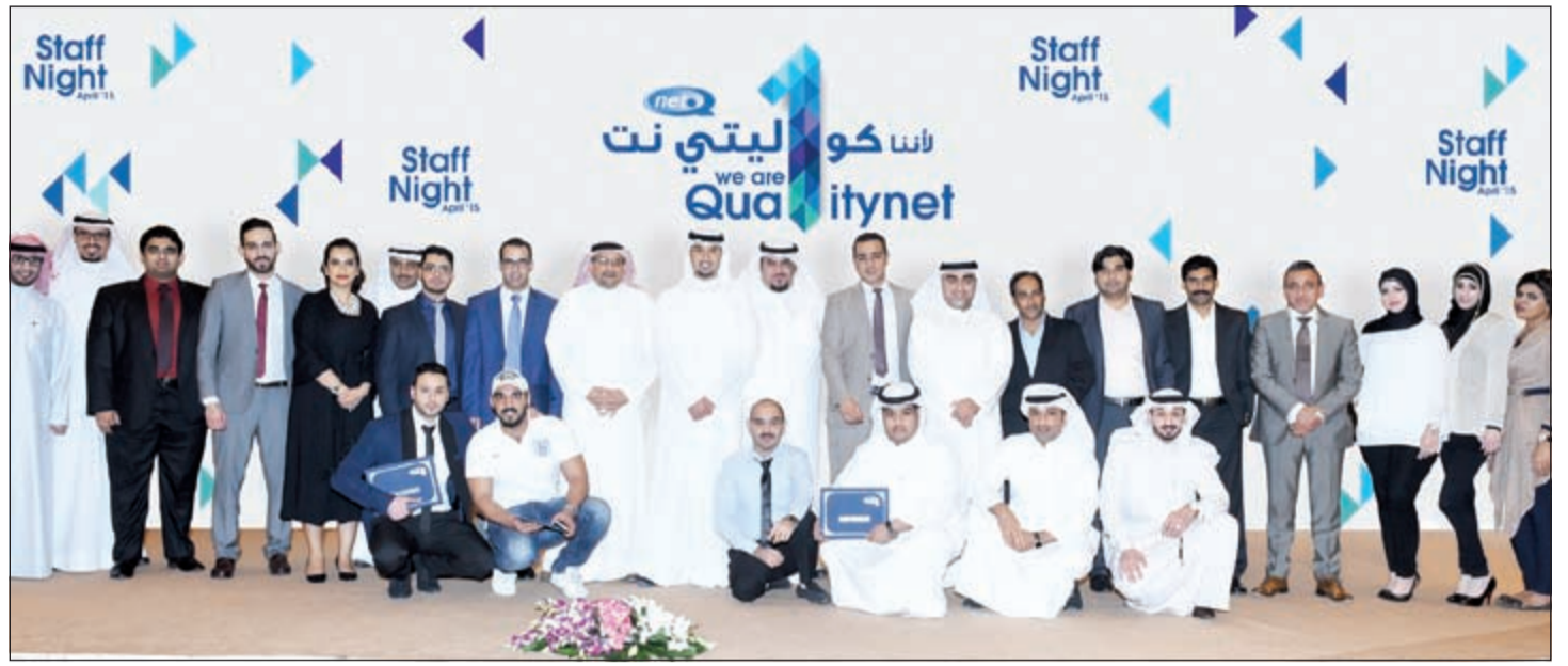
لقطة تذكارية لاداريي كواليتي نت مع الموظفين المكرمين