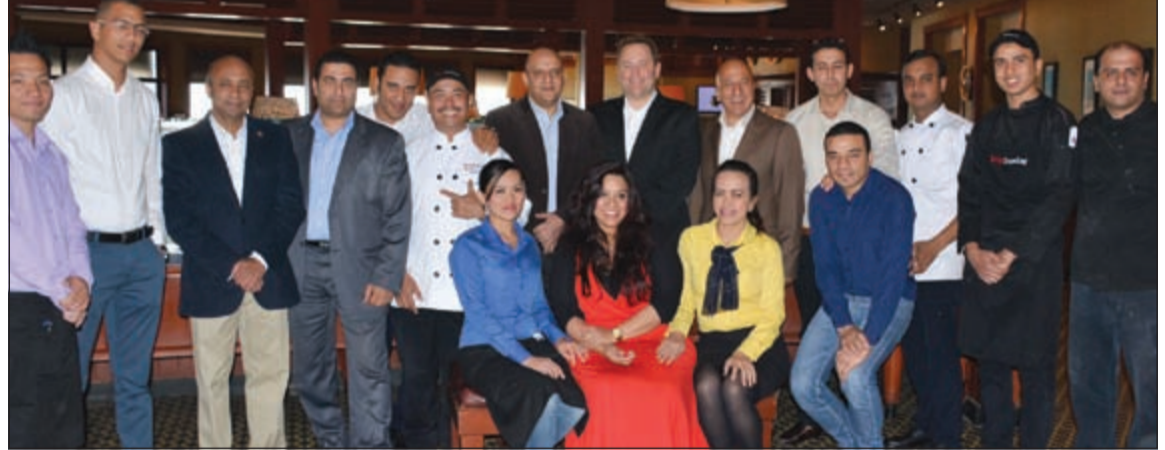
فريق عمل «روبي تيوزداي» في لقطة تذكارية

كما عودتكم سلسلة مطاعم روبي تيوزداي الكويت على تقديم كل جديد وقيم، أطلقت سلسلة مطاعم روبي تيوزداي قائمة الإفطار الجديدة في فرع شرق بجانب أبراج الكويت، وافتتح جوناثان لي نائب رئيس التشغيل لـروبي تيوزداي «العالمية مائدة الإعلاميين وتم عرض القائمة الجديدة على المدعوين. وإعرب عن سعادته الكبيرة برؤية التطور في الشرق الأوسط التي تحققتها سلسلة مطاعم روبي تيوزداي الكويت مع العلامة التجارية، إضافة هذه القائمة الجديدة لوجبة الإفطار وتقديم كل ما يحتاجه زبائننا من قيمة وجودة عالية. وقال في كلمته: «إن قائمة الإفطار الجديدة ما هي إلا دليل قاطع على الإبداع والتشكيلة الرائعة التي تقودنا إلى مستقبل مثير في المنطقة.» وأضاف: «في المستقبل القريب في خطة التوسع سيتم افتتاح عدة أفرع في دبي، وقطر، وأبوظبي، وعمان، والعراق، وأفرع أكثر في مصر بالإضافة إلى الأفرع الحالية في المملكة العربية السعودية، والكويت، ومصر، وتنتقل أيضاً لافتتاح في أفريقيا، هذا على صعيد الشرق الأوسط وأفريقيا، أما على الصعيد العالمي فهناك خطة لافتتاح عدة أفرع في كل من أميركا الجنوبية، وأوروبا وآسيا.» وذكر أيضاً ما تحتويه قائمة الإفطار من أطباق وأصناف مختلفة مثل بوفيه السلطات الصحية الخاص بالإفطار كبدية ليوم صحي، ونشط يتضمن الخبز بانواعه، والأجبان، والفوكه والخضراوات الطازجة، وجيوب الإفطار.