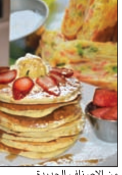
من الأصناف الجديدة