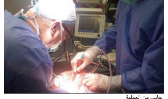
جانب من العملية