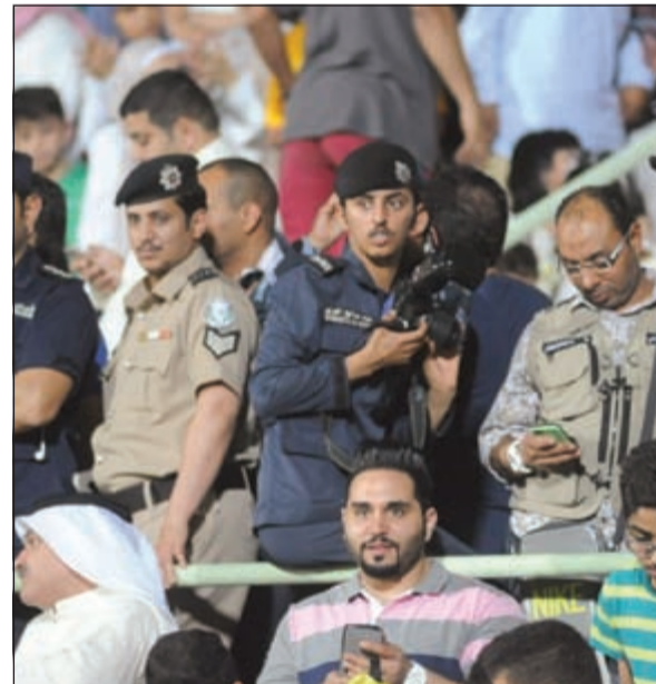
تواجد أممي كثيف