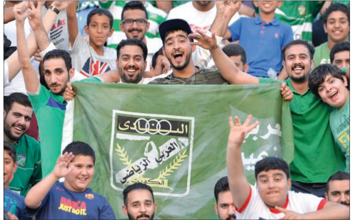
الجمهور العرابي يشجع