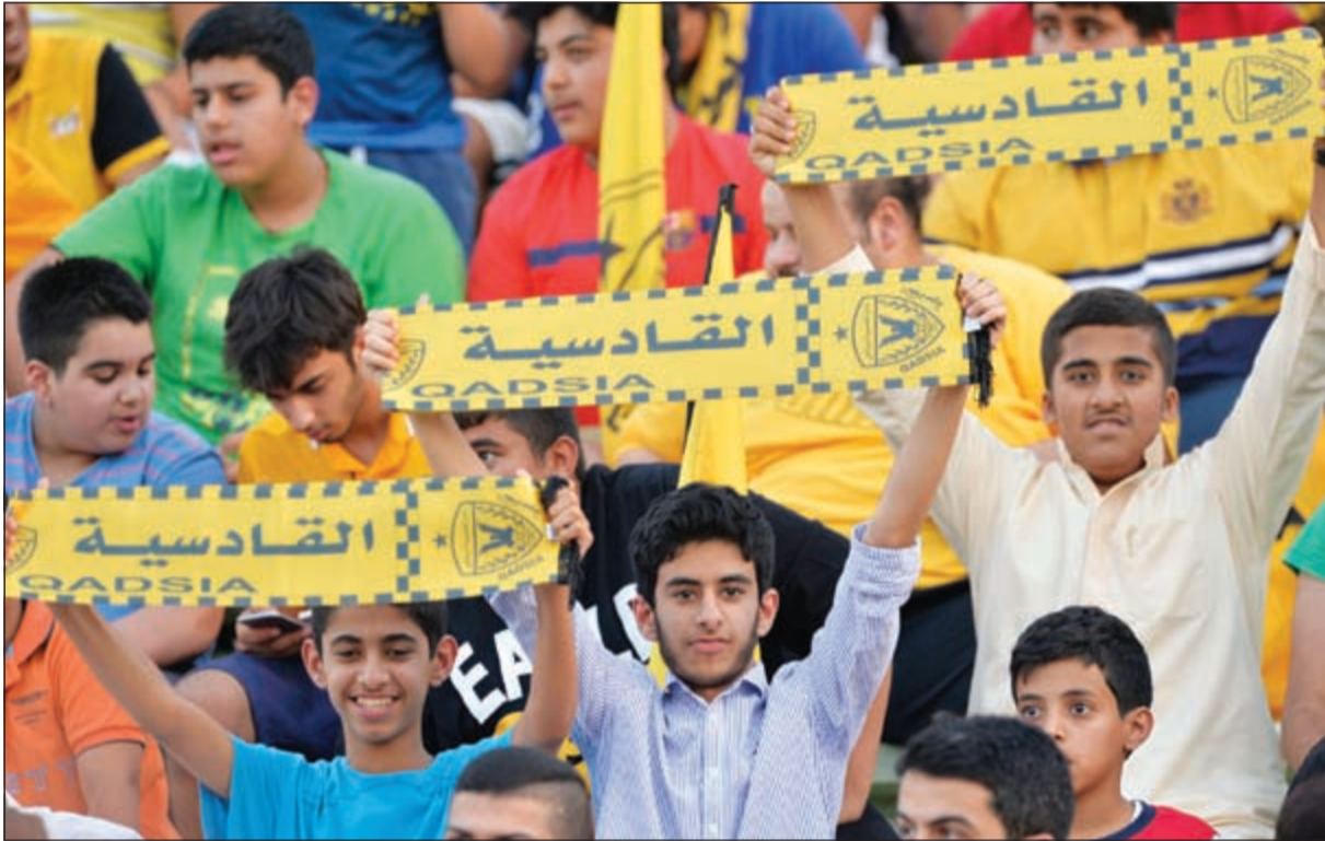
والجمهور القادسي يساند