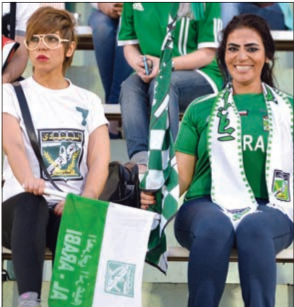
تشجيع مبكر في المباراة