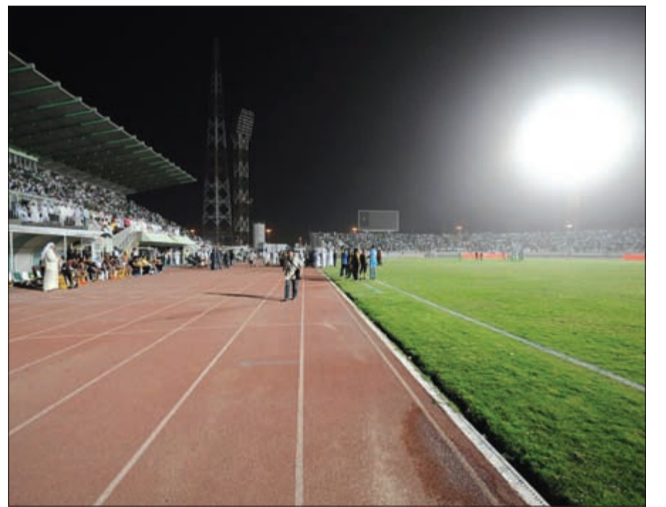
جزء من الملعب وتبدو الإضاءة خفيفة