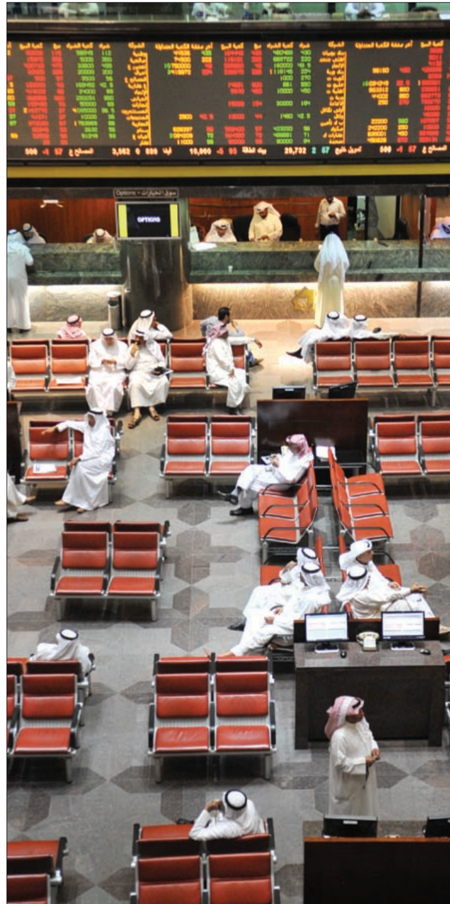
950 مليون دينار حجم صناديق الاسهم المحلية ونسبتها 3,2% فقط من حجم البورصة الكويتية ما يفتح الباب أمام حركة أكبر لاستثمار الافراد في السوق ورفع المخاطر