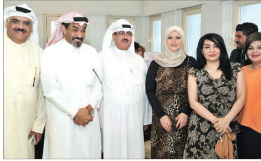
المبارك يتوسط نجوم الفن في مكتبه

توافد مجموعة من الفنانين منهم داود حسين وجمال الردهان وخالد المفدي وإبرار المفدي وغادة السنّي وآخرون بالإضافة إلى الإعلامية القديرة عائشة الجحى إلى مكتب الوكيل المساعد لشؤون قطاع الإذاعة الشيخ فهد مبارك عبدالله الأحمد الصباح ليقدّموا له الشكر والعرفان لما بذله من أجهلهم من تذليل كل الصعوبات وإشراكهم في الأعمال الدرامية المقررة لرمضان المقبل وإعطاء الفرصة لعدد كبير من الممثلين والمخرجين الإذاعيين ليصبحوا كخليفة النحل في عملهم. وفي السياق نفسه تم