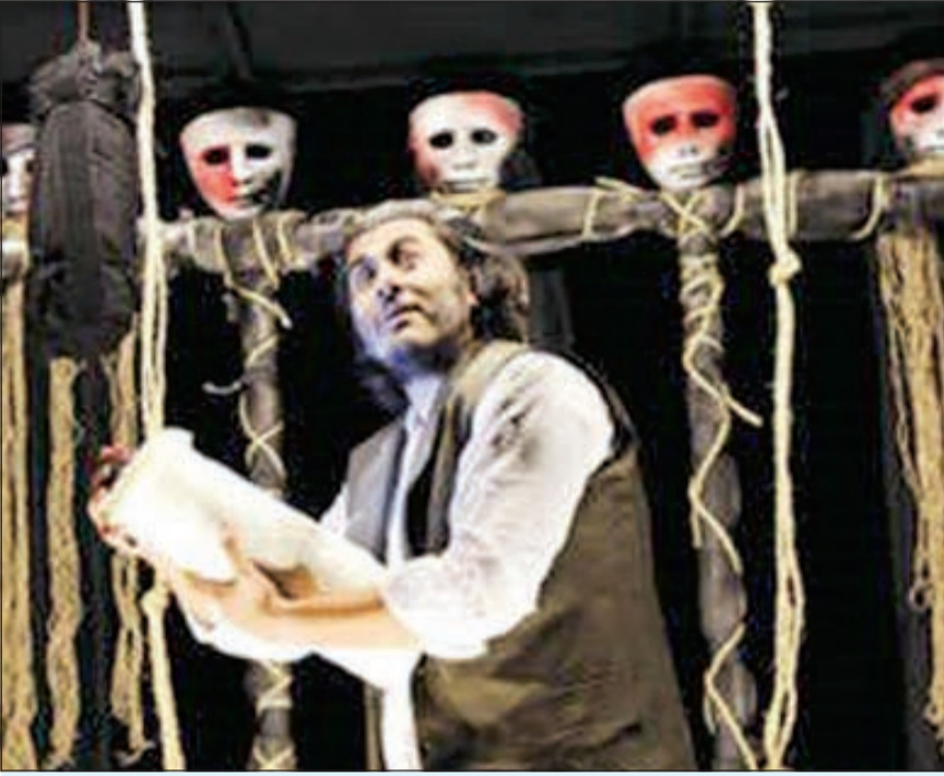
محمد كبير في «الضربة القاضية»