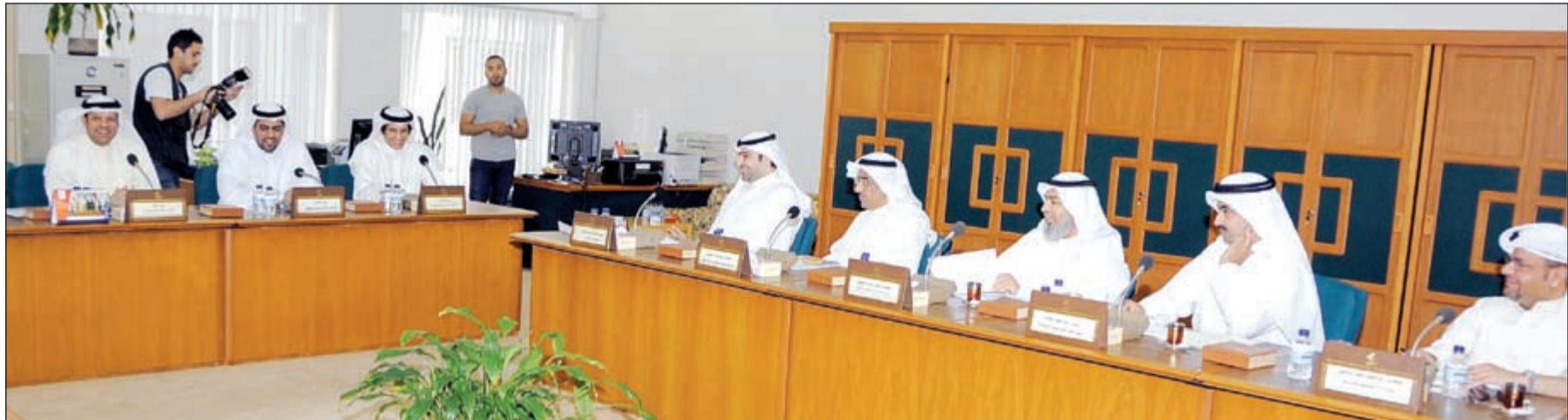
فيصل الكندري وراكان النصف ودمنصور الظفيري وياسر أبل وأركان وزارته أثناء اجتماع اللجنة الإسكانية أمس

وأكد أن المشروع يعتبر من أضخم المشاريع على مستوى المنطقة ويعتبر أول مشاريع الوزارة حسب برنامج عمل الحكومة على أن يتبعه مشروعاً جنوب منطقة سعد العبدالله والخيبر، ومشهداً على سعي الحكومة ومجلس الأمة لحل القضية بواقعية. وأضاف أن هناك من يعتقد أن توزيع الوحدات على المخطط «امر غير حقيقي ولكني أؤكد أن هذه التوزيعات على المخطط ليست بشيء جديد حيث سبق للمؤسسة أن قامت بذلك وتم تسليم الوحدات». وأوضح أن أغلب التوزيعات التي تمت خلال عام 2014/2015 طرحت مناقضاتها حيث يعمل المقاولون الآن في تلك المشاريع التي تخص توسعة الوفرة ومنطقة ابوحليفة، مشيراً إلى أن مناقضة مشروع غرب عبدالله المبارك طرحت بالفعل وسيتم توقيعها في يوليو المقبل. وحول نتائج توزيعات خطة الوزارة لعام 2014/2015 قال الوزير أبل إن الحكومة تعهدت بتوزيع 12,735 وحدة سكنية وتم بالفعل توزيع 12 ألف و30 وحدة سكنية حتى 31 مارس