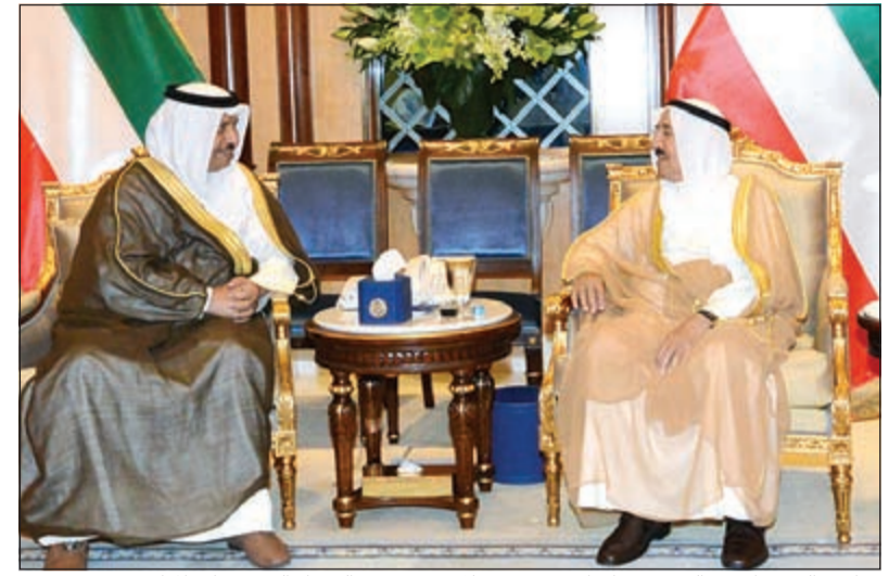
صاحب السمو الامير الشيخ صباح الاحمد مستقبلا سمو رئيس الوزراء الشيخ جابر المبارك

جمهورية بولندا الصديقة ضمنها سموه خالص تهانيه بمناسبة العيد الوطني لبلاده، متمنيا له موفور الصحة والعاقة. كما بعث سمو رئيس مجلس الوزراء الشيخ جابر المبارك ببرقية تهنئة مماثلة.