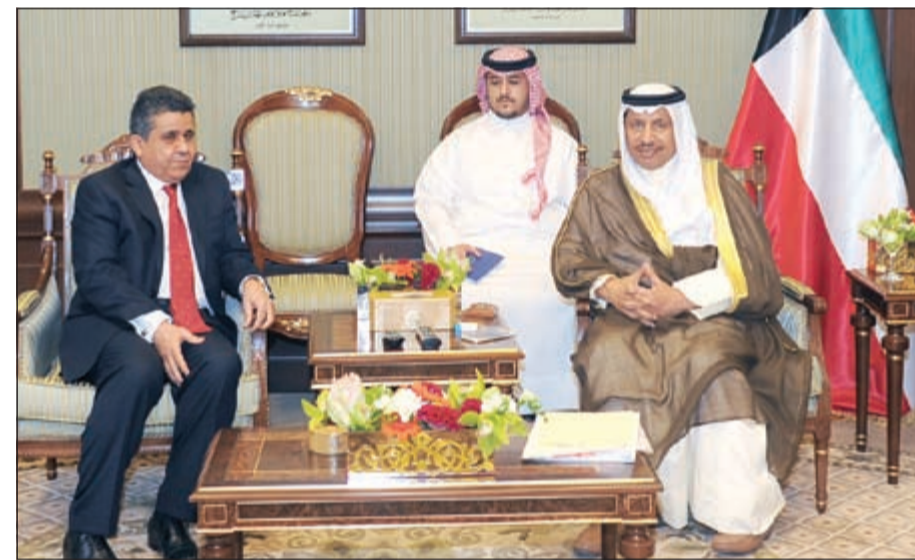
سمو رئيس مجلس الوزراء الشيخ جابر المبارك مستقبلا وزير الخارجية والتعاون الدولي الليبي

استقبال سمو الشيخ جابر المبارك رئيس مجلس الوزراء والنائب الاول لرئيس مجلس الوزراء ووزير الخارجية الشيخ صباح الخالد في قصر بيان امس وزير الخارجية والتعاون الدولي في الدولة الليبية محمد الهادي الدايري والوفد المرافق له وذلك بمناسبة زيارته للبلاد. حضر المقابلة سفيرنا لدى ليبيا مبارك العدواني.