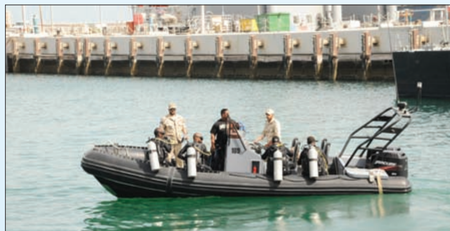
رجال وحدة الغوص في بدء عملية كسح أحد الزوارق

تأسيس القوة البحرية ووصول أول مجموعة زوارق جاء في وقت صعب جداً والمنطقة تغلي، حيث كانت الحرب الإيرانية-العراقية مستترة، وهذه الزوارق عملت طوال سنوات الحرب بجهد كامل وقوة كاملة حافظت على بحرنا من أي تأثير ناتج عن هذه الحرب،