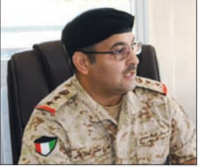
العميد ركن بحري هزاع العلاطي

قال أمر الوحدات العائمة العميد ركن بحري هزاع العلاطي إن من مهام الزوارق القيام بالأعمال الدورية للبحر الإقليمي للكويت والمياه الاقتصادية بالإضافة إلى إسناد القوات البرية الأمانة بالقرب من الساحل وأيضا القيام بعمليات البحث والإنقاذ. وعن مهام ضباط الوحدات العائمة في القاعدة البحرية، أشار العلاطي إلى أن المهمة الرئيسية لمهام ضباط الوحدات العائمة هي قيادة القطع البحرية وتنفيذ الواجبات المناطة للقوة البحرية من أعمال دورية والمحافظة على خطوط المواصلات البحرية. وحول الإجراءات التي يتم اتخاذها اتجاه سفينة دارت الشكوك حولها، بين أن طاقم الزورق يقوم بالتحدث إلى طاقمها عبر جهاز اللاسلكي ويطلب منها التوقف ومن ثم أخذ البيانات مثل اسم السفينة وعلم الدولة وحمولتها وبعد ذلك يتم تفتيش السفينة. ولفت إلى أن ضباط البحرية منذ توليته ملازما يتم تأهيله عبر برنامج كامل في القوة البحرية كل حسب تخصصه حتى يتقاعده وهناك ضباط مقاتلون وضباط فنيون وضباط إمداد وإسناد، وبداية تأهيل الضباط تكون داخل الكويت في المعهد التابع للقوة البحرية، بالإضافة إلى دورات خارجية خاصة بالضباط وضباط وهي دورات تأسيسية وتخصصية.