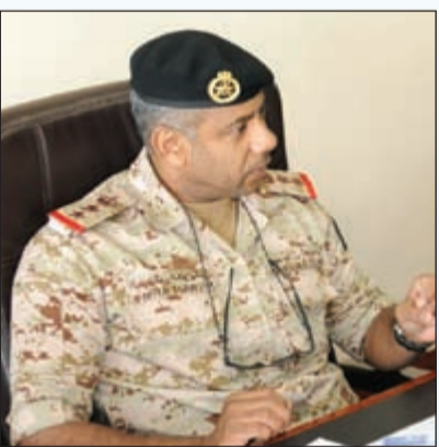
العميد ركن بحري وليد العبيدي

لفت مدير العمليات في القوة البحرية العميد ركن بحري وليد العبيدي إلى أن مديرية العمليات البحرية هي القلب النابض للقوة البحرية من حيث القيادة والتوجيه ومتابعة سير الأحداث اليومية على مدار الساعة ووضع الخطط ومتابعة تنفيذها لجميع العمليات والتمارين سواء في وقت الحرب أو السلم، والقوة البحرية الكويتية تعمل بالتنسيق والتناغم مع القوات الشقيقة والصديقة خلال التمارين واكتساب الخبرات وتبادل المعلومات وهناك تنسيق مستمر مع القوات البحرية الخليجية وهناك اجتماعات دورية سنوية تعقد لتبادل المعلومات والخبرات وإجراء التمارين المشتركة.