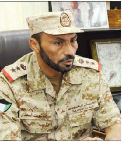
العميد ركن بحري ساكت السعيد

أكد مدير إدارة القوة البشرية في القوة البحرية العميد ركن بحري ساكت السعيد أن عدد منتسبي القوة البحرية لا يساهم به ويتم تأهيل 300 إلى 400 متطوع سنويا، مشيرا إلى هناك حوافز وبدلات مشجعة لاستقطاب الشباب الكويتي وأبناء الكويتيات، الذين سمح لهم مؤخرا بشرف الانسحاب إلى القوات المسلحة بالإضافة إلى الحوافز المعنوية وهي ابتعاثهم في دورات داخلية أو خارجية. وعن جنسيات طاقم صيانة الزوارق والقطع والمعدات البحرية، لفت السعيد إلى أن 75٪ من أفرادها كويتيين، بالإضافة إلى منتسبين من باكستان وبنغلاديش والهند، ونعمل على أن تكون جميع القطع البحرية تحت أيد كويتية بالكامل ونستغني من ذلك التخصصات النادرة للورش فقط.