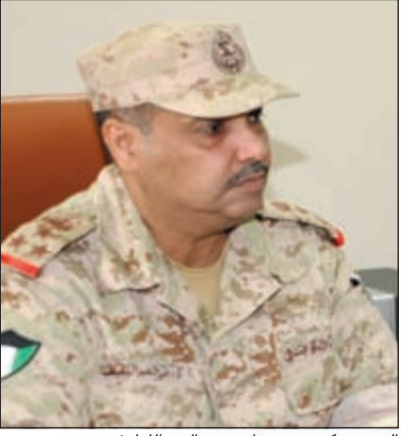
العميد ركن بحري إدريس العبد اللطيف