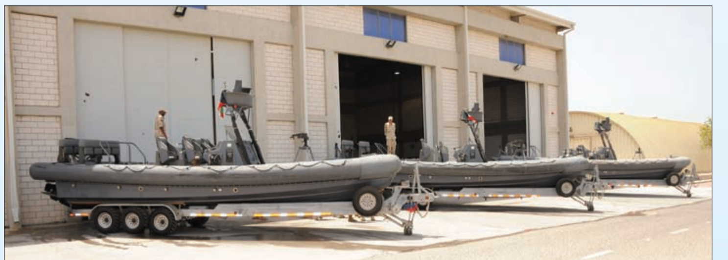
كتيبة المشاة البحرية

● في ظل الظروف المتأزمة التي تمر بها المنطقة، كيف تشرح جاهزية القوات البحرية، وهل من إجراءات خاصة وتدريبات لمواكبة التطورات؟