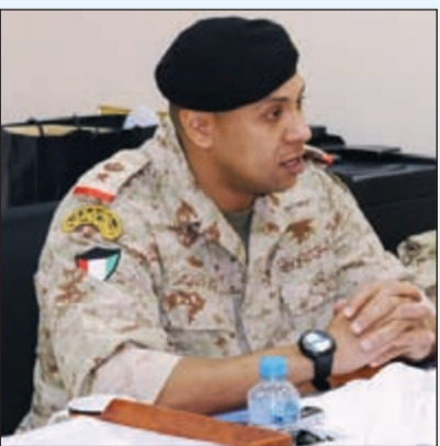
المقدم ركن بحري ماجد الماجد

أي ظروف، لافتا إلى مشاركة الضفادع البشرية في حرب تحرير العراق عام 2003 في القطاع الشمالي للبحر الكامل لمنع أي دخول وأي اختراقات من إرهابيين وميليشيات أو قوة نظامية والتصدية لها، وكانت هناك مجموعة من إحدى الجزر الكويتية الشمالية للانداز المبكر بالتنسيق مع خفر السواحل.