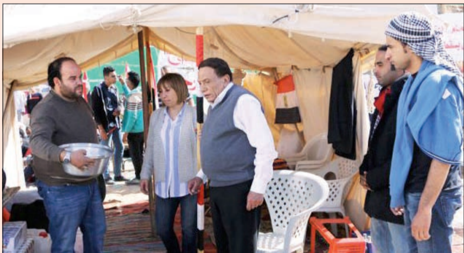
عادل امام في كواليس «أستاذ ورئيس قسم»

ويحرص الزعيم على عدم خروج أو دخول كاميرا فوتوغرافيا أو حتى أجهزة الهاتف المحمول الى الاستديو، وأحمد حلاوة وعلي ربيع، وهو من تأليف يوسف معاطي وإنتاج تامر مرسي وإخراج وائل إحسان.