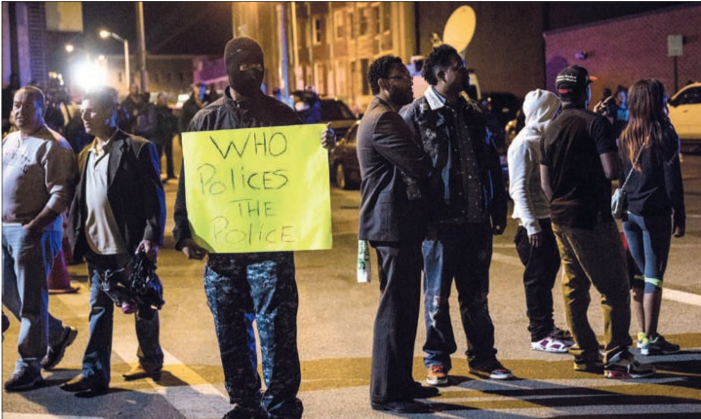
محتجون يرفعون لافتات تطلب بمحاسبة رجال الشرطة خلال تظاهرات سلمية في بالتيمور أمس الأول

طبيعة الاتهامات التي وجهت ولن يعلق على تفاصيل القضية. وتابع «اعتقد ان سكان بالتيمور يريدون الحقيقة أكثر من أي شيء آخر. وهذا ما يتوقعه الناس في كل أنحاء البلاد». وكان قائد شرطة بالتيمور انتوني باتس قد قال في وقت سابق «سنأخذ توجيهاتنا من المدعي العام لأن المسألة باتت من صلاحياته».