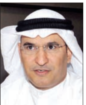
السفير منصور العتبي

ودعا إيران الى زيادة تعاونها وبشفافية تامة مع الوكالة الدولية للطاقة الذرية وتنفيذ الخطوات والإيضاحات التي تطلبها الوكالة، معربا عن أمه في أن تتكفل جهود كل الأطراف في التوصل الى اتفاق نهائي وشامل للملف النووي الإيراني في نهاية المطاف.