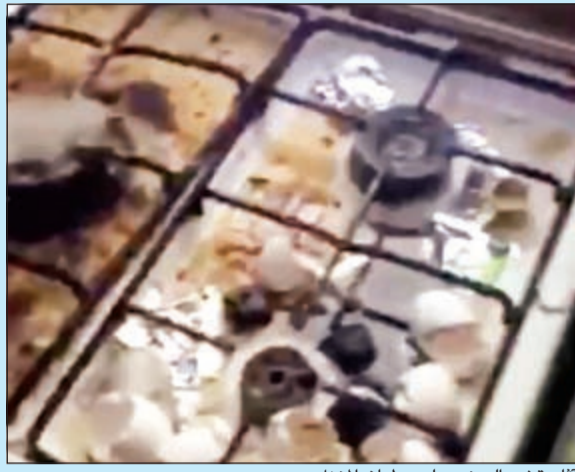
آثار قشر البيض على «طباخ المنزل»

مفاجأة، بل كارثة إنسانية حقيقية يكشف عنها بلاغ حريق للإطفاء، بوجود 3 أطفال يعيشون محتجزين في شقة مغلقة منذ أكثر من 3 أشهر بلا معيل، وإن أكبر الأطفال الثلاثة في الشقة فتاة يبلغ عمرها 12 عاماً، وأنها هي من تقوم بتأمين الغذاء لشقيقتها (3 و 5 أعوام) طوال الأشهر الثلاثة الماضية، وذلك عبر تسلقها عن طريق شبك صغير في الشقة المحبوسين بداخلها والتوجه إلى الفرع القريب لتتسول لساعة أو لساعتين من أجل الطعام وتعود به إلى شقيقتها لتتعطها، وهكذا كانت تفعل يومياً لـ 3 أشهر، قبل أن يكشف بلاغ الحريق الكاذب الشقة المحتجز بداخلها الأطفال