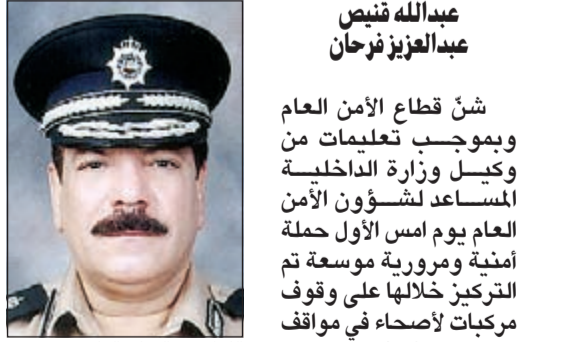
اللواء عبدالفتاح العلي

مصدر اممي ان رجال أمن الجهراء أوقفوا 5 وافدين مصريين كانوا في مركبة واحدة وكانوا جميعهم يدخنون سجائر بها حشيش، وعثر معهم على مواد مخدرة. وفي منطقة الأحمدية القسي القبض من قبل دوريات النجدة على شابين احدهما خليجي وعثر