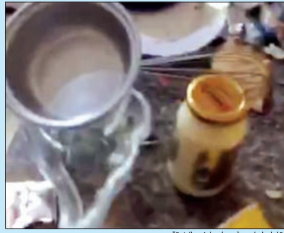
بقايا طعام عثر عليها في الشقة

ادعائها - أنها محبوسة في الشقة مع شقيقتها منذ 3 أشهر وأنها لا تعرف أين رجال الإطفاء. ويقول مصدر أممي مشرف على الواقعة تحدثنا مع الطفلة وأبلغتنا - بحسب