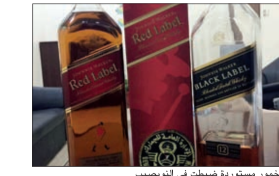
خمور مستوردة ضبطت في النويصيب