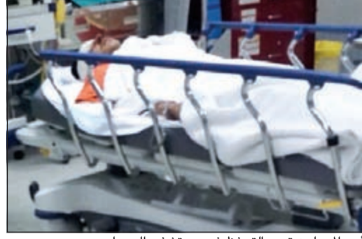
أحد المصابين تحت التحفظ في مستشفى الجهراء

الأمم فيما أخرج عدد منهم الأسلحة البيضاء وتم ضبط المتهم الذي قاوم رجال الأمن مقاومة شرسة وتمت السيطرة عليه، وتابع المصدر أن الشخص الذي تم ضبطه شقيق الهارب الذي اصطدم بإحدى الدوريات أثناء فراره. وأضاف المصدر أن هناك مجموعة من الشباب المتجمهرين أعاقوا عمل الشرطة في ضبط الجنسة من خلال رميهم الحجارة على رجال النجدة الذين قاموا بنقل الشخص المصنوب وهو مواطن من أرباب السواقي السى المستشفى لتلقي العلاج.