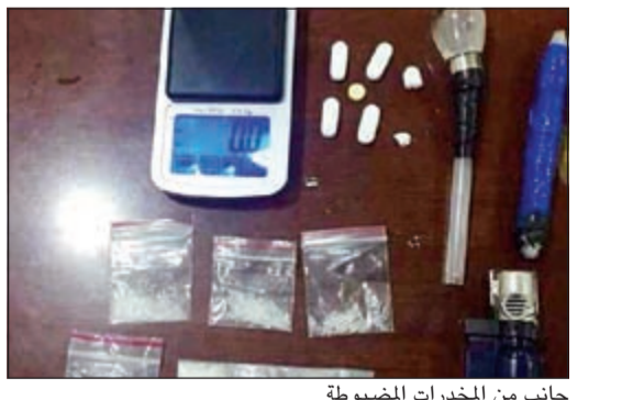
جانب من المخدرات المضبوطة