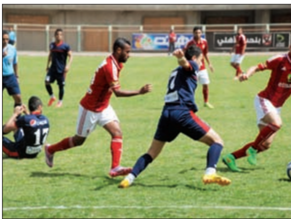
لاعبو الأهلي مستعدون للمقاء المغرب التطواني

بينما يلتقي الجونة صاحب المركز الثاني عشر برصيد 31 نقطة مع الرجاء صاحب المركز الـ 17 برصيد 23 نقطة على ملعب الأول بستان الجونة في الغرقنة.