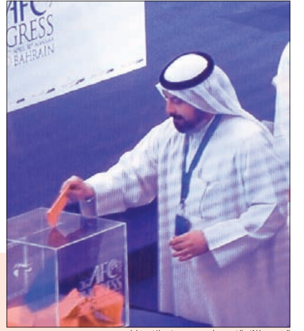
الشيخ طلال الفهد يدلي بصوته في الانتخابات