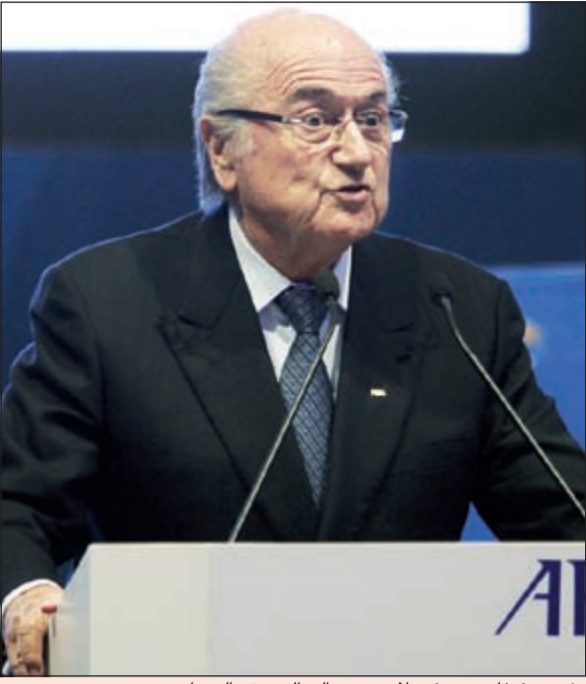
رئيس «فيفا» جوزيف بلاتر يدعو إلى الوحدة والتضامن