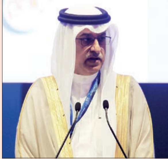
الشيخ سلمان بن إبراهيم يتحدث للحاضرين

وانحصر الصراع على مقعد السنوات الأربع بين مرشحي شرق القارة وكان سبق تركية الفهد الإعلان رسمياً عن بدء الولاية الجديدة لأربع سنوات للشيخ سلمان بن إبراهيم آل خليفة. وفي انتخابات مقعد «فيفا» عن شرق آسيا فاز كل مرشح اليابان كوشو تاشيما 36 صوتاً والماليزي تانكو عبدالله 25 صوتاً فيما نال كل من الكوري الجنوبي مونج هيو تشونغ والتايلاندي لارواي ماكودي 13 صوتاً، ليخرج ماكودي من تنفيذية «فيفا».