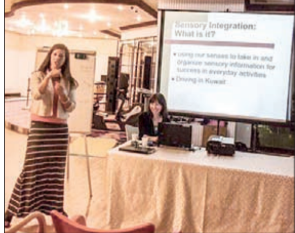
جانبا من المحاضرة التوعوية في مركز «21»

على أبنائهم من ذوي الإعاقات الذهنية، بغية الوصول إلى أفضل السبل لمساعدتهم على العيش برغد وأمان. من جهة أخرى، قالت دويل إن التكامل الحسي يساعد المنتسبين على رفع قدراتهم والتحكم في عملية التركيز والإبداع.