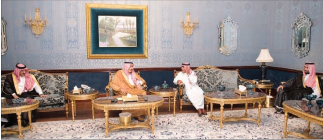
خادم الحرمين الشريفين الملك سلمان بن عبدالعزيز خلال زيارته مساء أول من أمس لأخيه صاحب السمو الملكي الأمير مقرن بن عبدالعزيز في قصره بالرياض بحضور ولي العهد وولي ولي العهد

خادم الحرمين يزور الأمير مقرن في قصره بالرياض برفقة ولي العهد وولي ولي العهد السفير السعودي: الملك سلمان وضع خارطة طريق لمستقبل المملكة