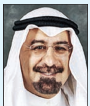
الشيخ د.محمد الصباح

محمد الصباح: الكويت لديها ربان ماهر وحكيم في ظل أمواج متلاطمة