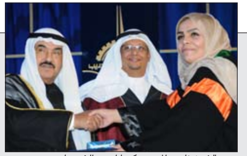
سمو الشيخ ناصر المحمد مكرما إحدى الخريجات

آسيا القوية ضمانة «الفيفا».. وتزكية الفهد وفوز لوانحه بنتيجة كاسحة 29