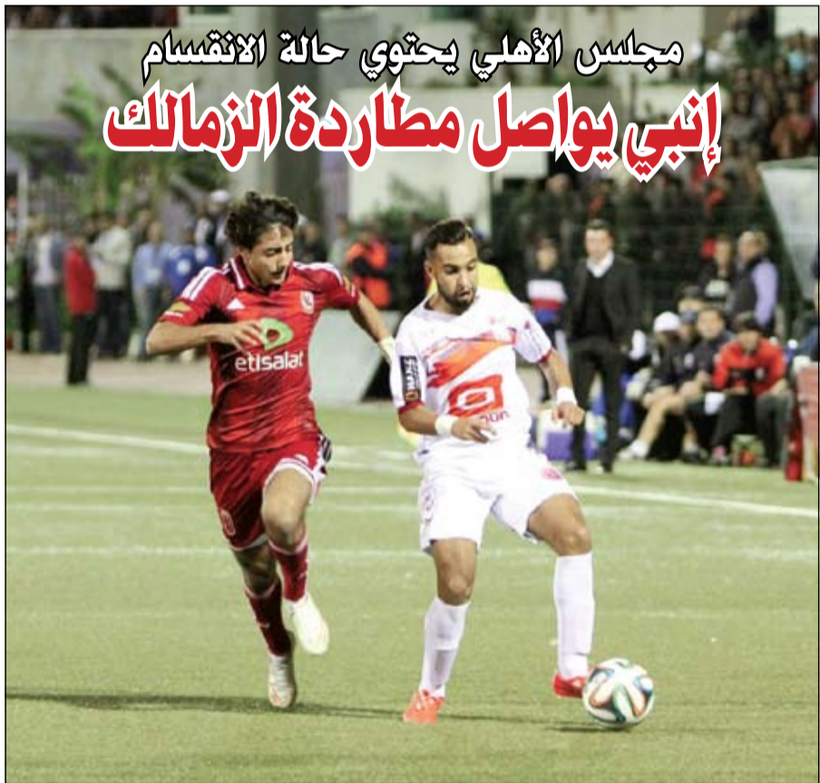
الأهلي يسعى لتجاوز المغرب التطواني والاستمرار في البطولة الأفريقية