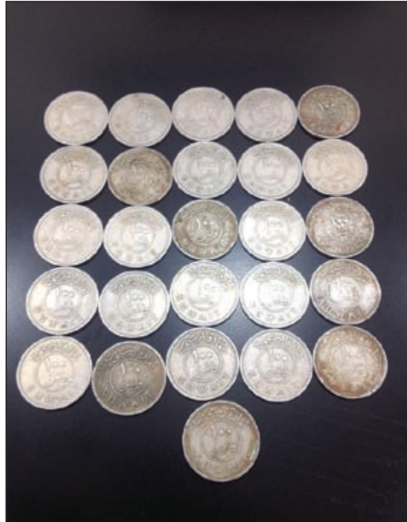
26 عملة من فئة 100 فلس (إمارة الكويت) يصل سعرها إلى أكثر من 50 دينارا (أي أن دينارين و600 فلس قيمتها البنكية يمكن أن تصل إلى 52 دينارا بحسب دينارين لكل عملة)