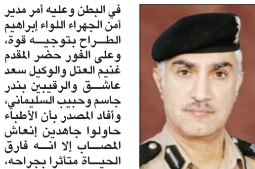
اللواء إبراهيم الطراج

بمنطقة سعد العبدالله وفوجئوا بشخص يدخل اليهم ويصوب سلاحه نوع «شوزن» إلى المجني عليه قائلاً أنت تتحدث عني دون ان أعلم وأطلق النار عليه ليترك المكان الأمر الذي دفعني لإسعاف زميلي إلى المستشفى. وأرذف المصدر بان الجاني المصاب إلا أنه فارق الحياة متأثراً بجراحه، فيما أفاد المسعف بان زميله في العمل بورابة الكهرباء وتحديداً في طوارئ الكهرباء كانا مع المسعف والمجني عليه في نفس الوزارة.