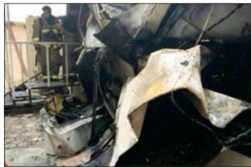
من حريق مدرسة الجهراء امس الاول

وقال والد إحدى الطالبات التي تعرضت إلى الحرق في مدرسة لولوة القعود المتوسطة بنات إن إدارة المدرسة ساهمت في تعرض بناتهن للحظر، وذلك من خلال احتجاز أكثر من 60 طالبة في أحد الفصول وعدم إعطاء الطالبات التلفون للاتصال بأولياء أمورهن ومنعهن من ذلك الأمر الذي جعلهن يتعرضن للاختناق من النيران.