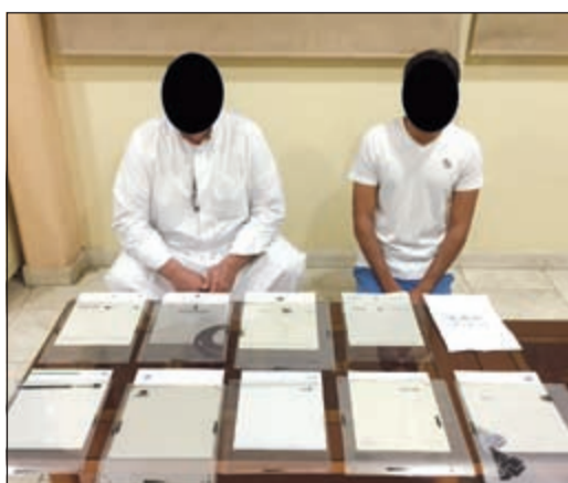
التهمة وأمامها المعاملات قبل بيعها على المستفيدين

تمكن رجال مديرية أمن العاصمة من إخماد حريق شب في إحدى الغرف وذلك قبل وصول مركز إطفاء المدينة، وقال مصدر أمني ان رجال الامن استخدموا مطفآت الحريق لإخماد السنة اللهب والتي اندلعت جراء تماس في شفاط الغرفة.