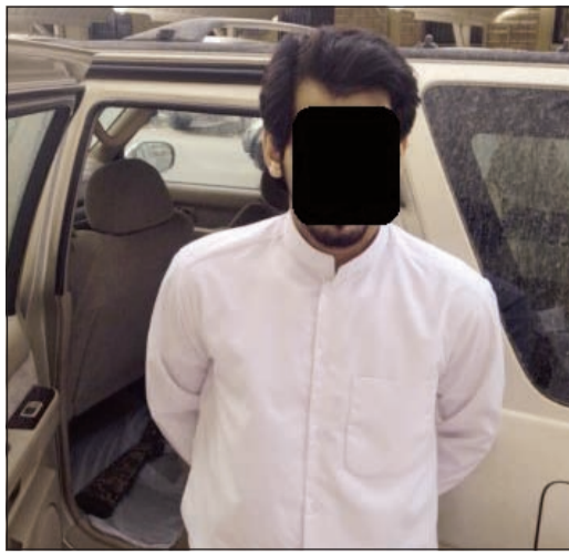
التهمة بعد تسليم نفسه

لم يجد 3 أشخاص شيئاً يسرقونه من وافد يحمل الجنسية الهندية أثناء محاولة سلبه فتم الاعتداء عليه بالضرب لأنه لم يكن يحمل نقوداً (مفلس)، فتوجه الوافد إلى المخفر مصطحباً تقريراً طبياً يفيد بما تعرض له من إصابات، وقال مصدر أمني ان العقيد وليد الشهاب قام بإحالة ملف قضية سلب واعتداء بالضرب لوافد هندي لمباحث الفروانية للبحث عن 3 أشخاص ، اثنان منهما يحملان الجنسية السورية وزود رجال الأمن ببياناتهم، حيث أفاد الوافد بأنه كان يسير على الأقدام قرب حديقة الفروانية وفوجئ بثلاثة أشخاص طالبوا منه بحافظة نقوده وعندما امتثل لأمرهم قاموا بالاعتداء عليه بالضرب لأنه لا يحمل نقوداً وتم تسجيل قضية.