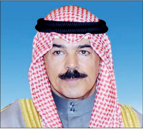
الشيخ محمد الخالد

يغادر البلاد صباح اليوم الأربعاء نائب رئيس مجلس الوزراء ووزير الداخلية الشيخ محمد الخالد متوجهاً إلى دولة قطر الشقيقة على رأس وفد أمني رفيع المستوى لحضور اللقاء التشاوري السادس عشر لوزراء الداخلية بدول مجلس التعاون لدول الخليج العربية والمقرر انعقاده في الدوحة عاصمة دولة قطر.