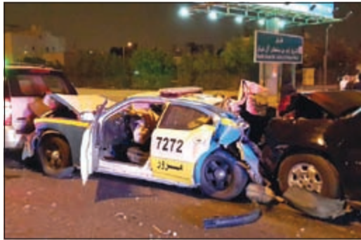
الدورية وقد انحسرت بين مركبتين

أسفر حادث تصادم رباعي فجر أمس عن إصابة مواطن بإصابات طفيفة على طريق الدائري الخامس وتم سحب المركبات وإحالتها إلى التحقيق لمعرفة أسباب الحادث، وقال مصدر أمني ان بلاغاً ورد إلى غرفة عمليات الداخلية عن تصادم مركبة على طريق الشيخ زايد وتحديداً قرب منطقة العمرية كانت تقوم بسحب طراد وتوجهت إليها دورية تابعة لقطاع المرور لتفادي الموقف وسحب المركبة المتعطله إلا ان قائد مركبة اصطدم بالدورية ومركبتين بالإضافة إلى الطراد ليتهم نقل أحد أطراف الحادث إلى المستشفى نتيجة تعرضه لإصابات.