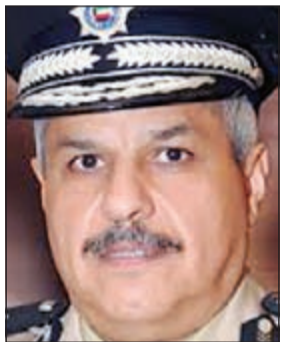
اللواء الشيخ مازن الجراح

علمت «الأنباء» ان الوكيل المساعد لقطاع الجنسية ووثائق السفر اللواء الشيخ مازن الجراح أصدر تعميماً يتضمن إلغاء المعاملات الورقية التي يتم تعيبتها من قبل الطابعين خارج الإدارات وتقديمها إلى إدارات الهجرة على أن يستعاض