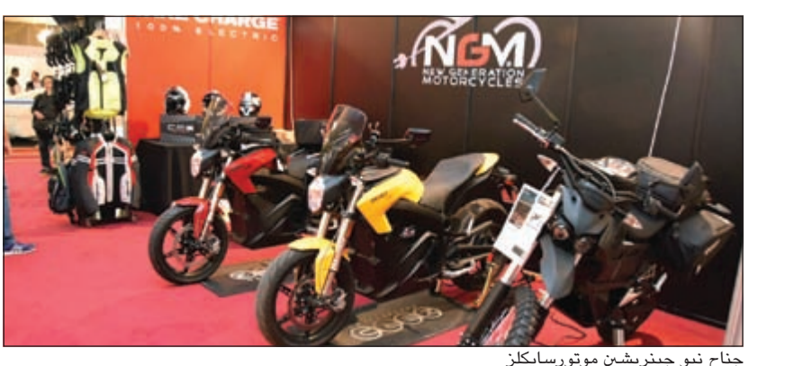
جناح نيو جينريشين موتورسايلكلز

في إطار دعم المشاريع الصغيرة في الكويت وحرصا على تقديم كل ما هو جديد في عالم الدراجات، شاركت شركة نيو جينريشين موتورسايلكلز (NGM)، الوكيل الحصري للدراجات الكهربائية Zero Motorcycles في الكويت، كراع بلاتيني في ملتقى ومعرض المشاريع الصغيرة لأعضاء نادي مركز بورشه الكويت. وافتح المعرض، الذي استمر لـ 3 أيام، الشيخ محمد الخالد الجراح الصباح رئيس لجنة الحلبيات والسرعة في نادي الشيخ باسل السالم الصباح في قاعة اللؤلؤة في فندق السفير. وأعرب المدير العام لشركة نيو جينريشين موتورسايلكلز (NGM)، علي فيصل المطوع عن سعادته بالمشاركة والرعاية لهذا المعرض الذي يدعم المشاريع الصغيرة وقال: تأتي مشاركتنا في هذا المعرض تشجيعا منس للمماردين الكويتيين لتأسيس وإدارة المشاريع الصغيرة وتبادل التجارب والخبرات في هذا المجال ليصبحوا تجار الغد. وعرض جناح نيو جينريشين موتورسايلكلز (NGM) خلال المعرض الدراجات الكهربائية Zero Motorcycles التي تصنع في ولاية كاليفورنيا الأميركية. وتمتاز هذه الدراجات بكفاءة عالية، حيث تعد من أكثر الدراجات قوة في البناء والتصمة للتعامل مع الطرق العادية والوعرة على حد سواء. كما وتمتاز هذه الدراجات الكهربائية